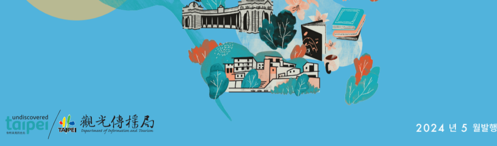
2024년 5월 발행