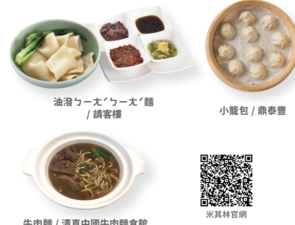
油滑「ㄉㄞ」ㄉㄞ」麵 / 請客樓

此外，必比登推薦更涵蓋數十間街頭小吃，從遠近馳名的臭豆腐、滷味、小籠包，到穆斯林也喜愛的道地牛肉麵，以及台北人日常三餐的涼麵、黑白切、蚵仔煎等庶民美食，這些道地台灣味，也是體驗台北人飲食的絕佳選擇。