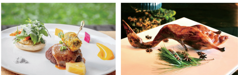
御品嫩豬排 / 陽明春天