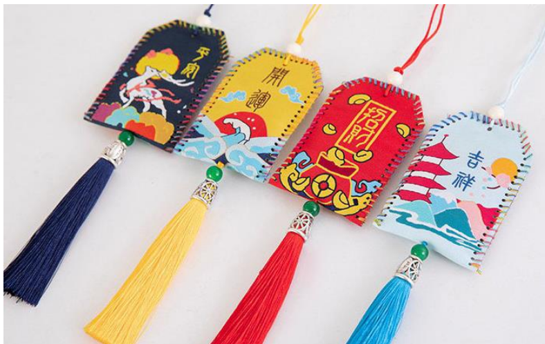
開運御守成品示意圖