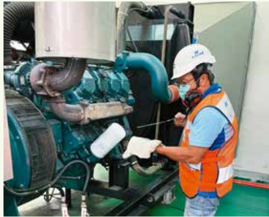
水利處會在颱風來臨前，做好抽水站的各項整備工作。