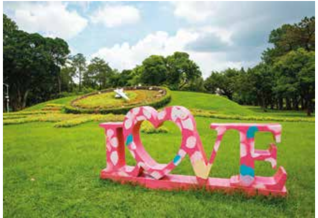
青年公園的花鐘是許多民眾造訪打卡的熱門景點。