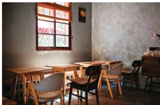
左：雪燕白湯的川味擔擔拉麵，以水菜代替很多人不吃的香菜，減少食物浪費。右：「無口小廚」空間設計融合當代極簡風格與老件，打造清新的用餐空間。