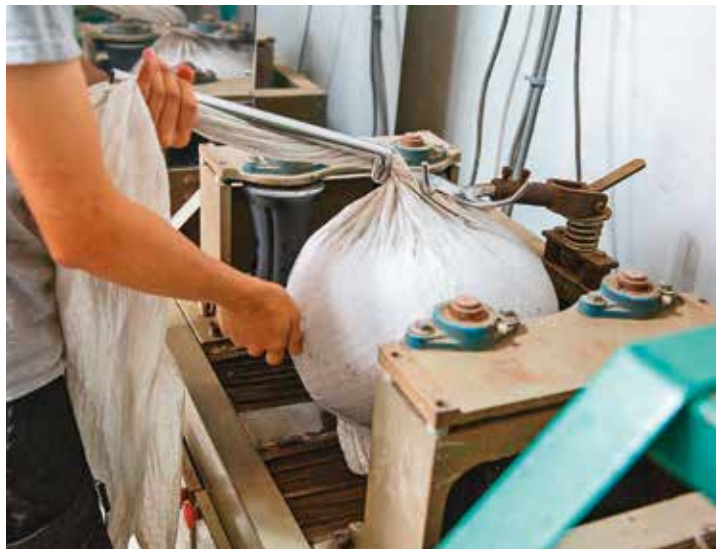
左：製茶師手工揀選和揉茶，是傳統製茶最大的特色。 右：製茶過程所施加的力道大小，會影響茶湯呈現的風味。