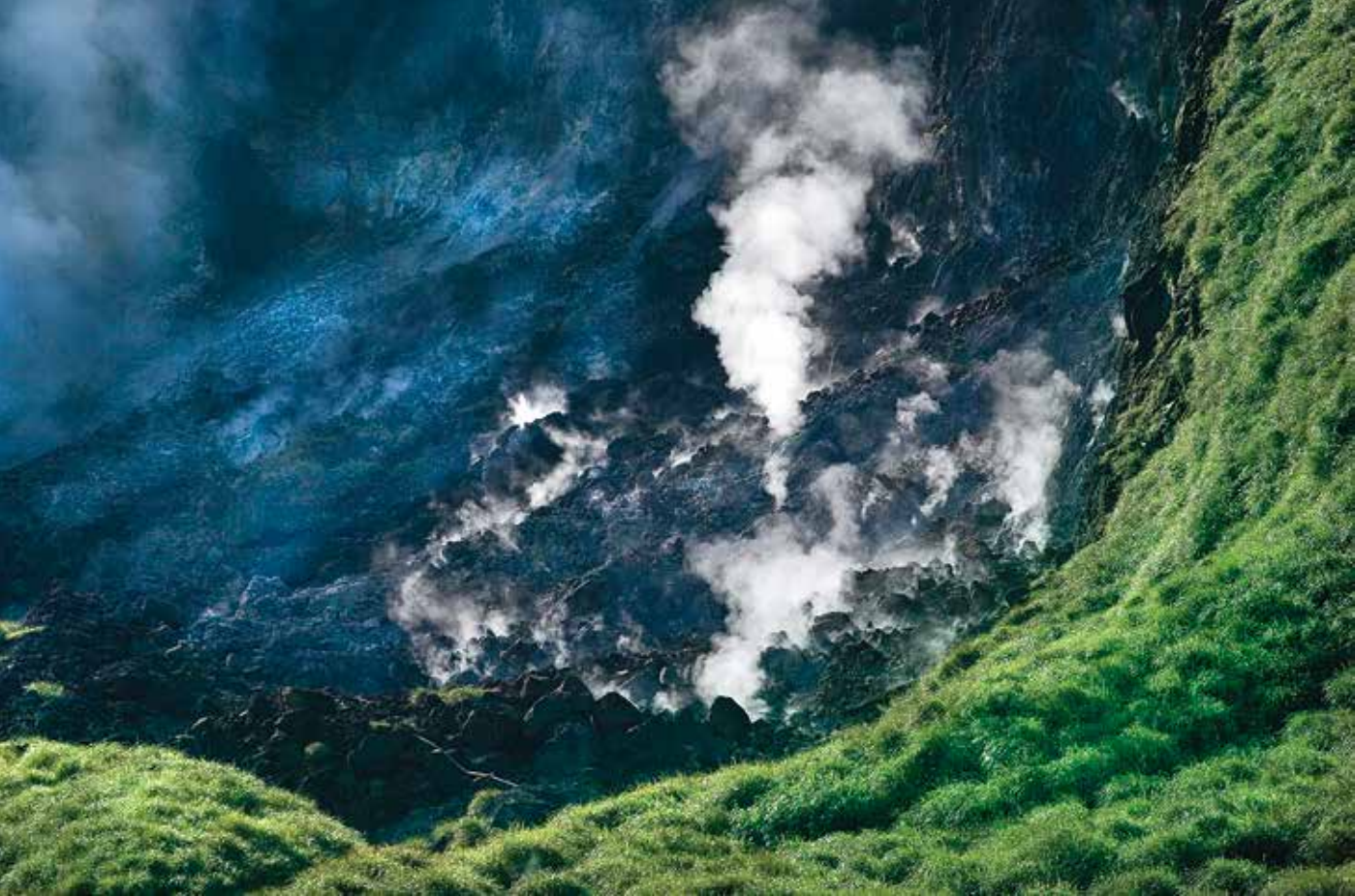
上：小油坑 下：陽明山