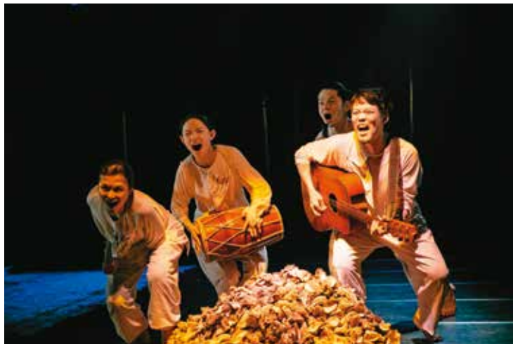
左：小朋友聚精會神地看著偶戲表演，沉浸在看戲的快樂中。 右：《蚵仔夜行軍》親子版以魔幻的蚵仔寓言展開，由小蚵仔帶著觀眾歷經一場回擊汙染事件的冒險，帶動生態環境與土地變化的思考。