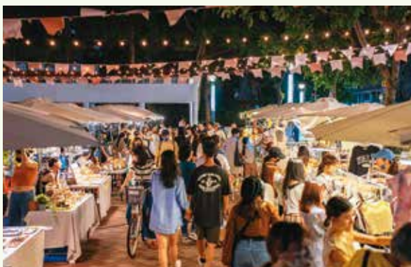
冰涼一夏市集從下午直至晚上，吃喝玩樂一站滿足。

今年也特別舉辦「潮 FUN 三重送」消費活動「1 留 2 抽 3 獎」，第一波自7月9日至16日在「混東區」粉絲專頁進行留言，即有機會獲得東區特約店家消費券500元；第二波預計將於7月29日至8月31日，在東區特約店家消費，不限消費金額，有機會獲