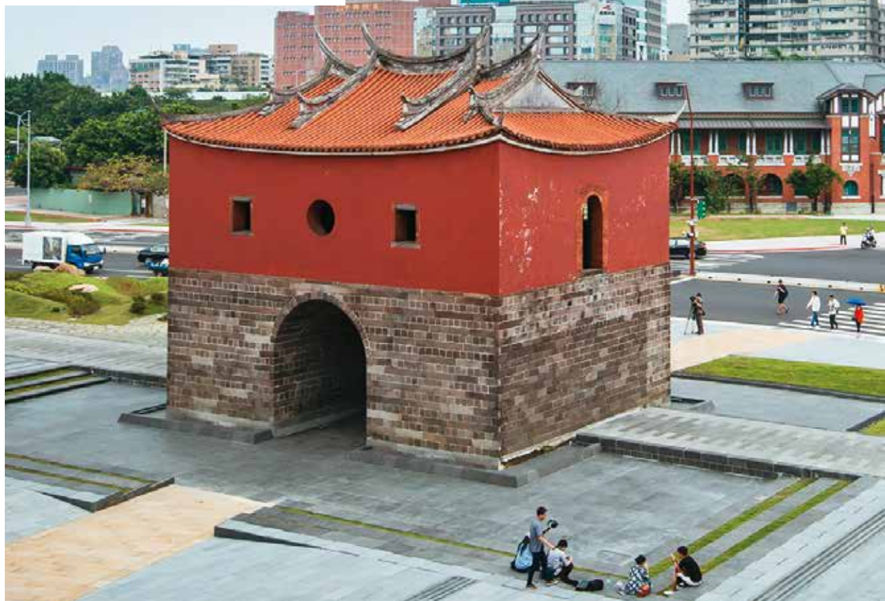
圖 財團法人蔣渭水文化基金會