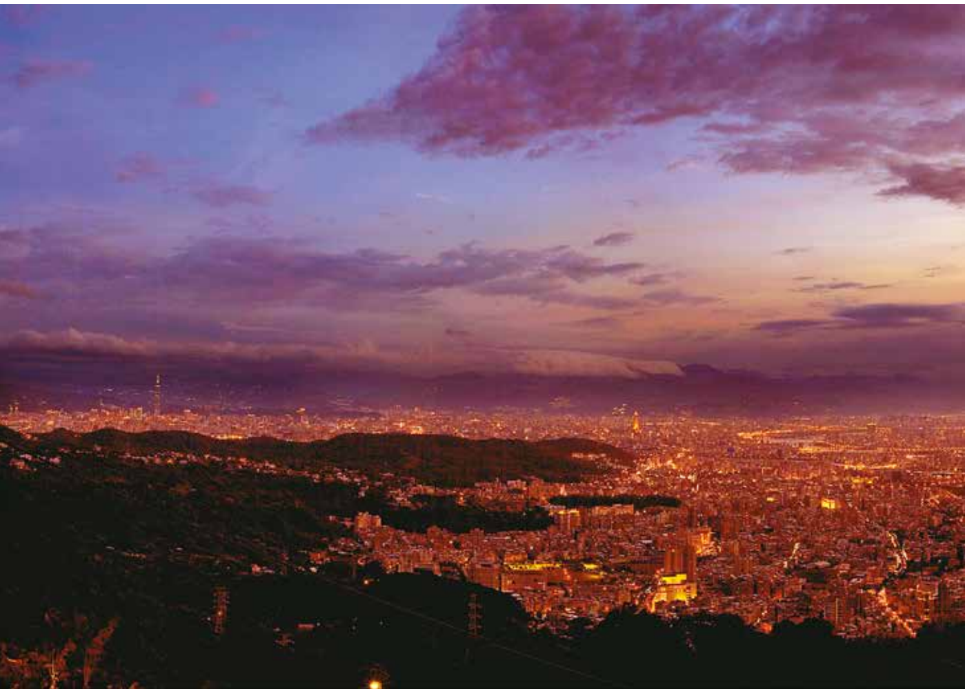
中國文化大學後山情人坡夜景