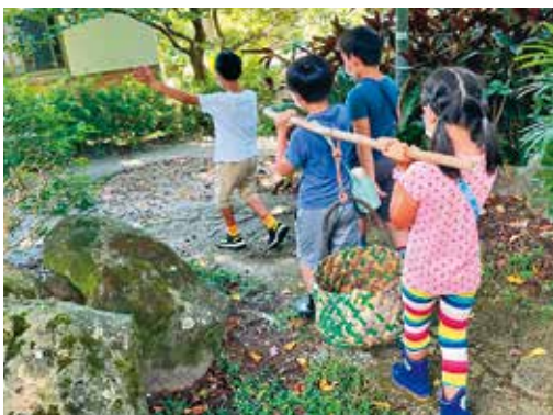
小朋友在產地親身體驗採收作物的樂趣。

此外，「竹子湖藍鵲農園」因位處竹子湖，夏天氣候比平地舒爽而成為避暑好去處，農場主人也用心規畫相當多的食農體驗田園教學活動，像是親子米食DIY、野外求生、雙語田園營等，都吸引許多大、小朋友前來體驗，孩子們也可在此體驗插秧感受農事辛勞，進而了解惜食的重要。