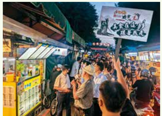
來台北夜市打牙祭，一同選出十大夜市神美食。

喜愛品嚐各式料理、對食物有獨特見解及夜市控，都歡迎前來報名加入平民美食評鑑家行列，所推薦的料理美食若獲選為「十大夜市神美食」，還能獲得新台幣5,000元獎金。活動開跑後參與的10個夜市都各配置20名評鑑家，每位評鑑家分別推選一項料理，預計將獲選的200項料理於9月交由民眾線上票選出前20名進