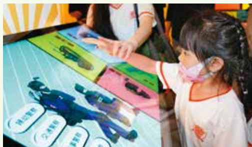
特展以各種互動裝置讓小朋友更加認識人民保母。

和「毒品藥物初篩檢測試劑」等，皆為此次展覽特地向警察局刑事鑑識中心商借，現場還展出科技偵查工具「警用無人機」，更有全台首創的警車配備之一「安撫熊」布偶。