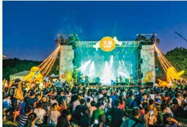
「天母啤酒節」以音樂、啤酒High到最高點。

此外，去年銷售一空、人氣爆棚的「天母特仕款」啤酒，今年推出「天龍2.0」、「湧金牌檸檬啤酒」等7款限量口味，喝出