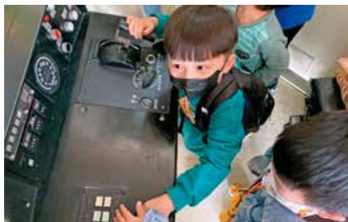
小朋友樂此不疲地在逃生體驗營中試玩機關、按鈕。

另一處寓教於樂的場館好去處，則是位在台北車站附近的「國立台灣博物館」。本館、古生物館、鐵道部園區、南門館等四館聯合票價只要百元出頭，即可帶著孩子來一趟親子知性遊。「其中最吸引孩子的，莫過於古生物館裡的恐龍，小朋友看到幾乎都會尖叫！」可大王分享，在本館裡悠遊歷史、在古生物館中考古古生物、在鐵道