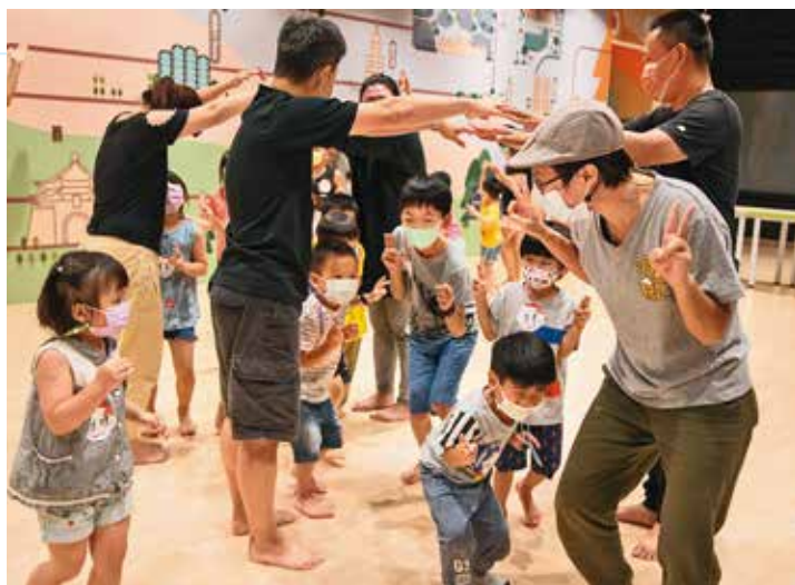
國家兩廳院舉辦親子可共同參與的系列活動，引領大、小朋友體驗藝術的魅力。

感受到兒女對這段情節的恐懼，返家後便向孩子解釋台灣民間對陰曹地府的想像，告訴他們引路的無頭鬼並不是來害人的。