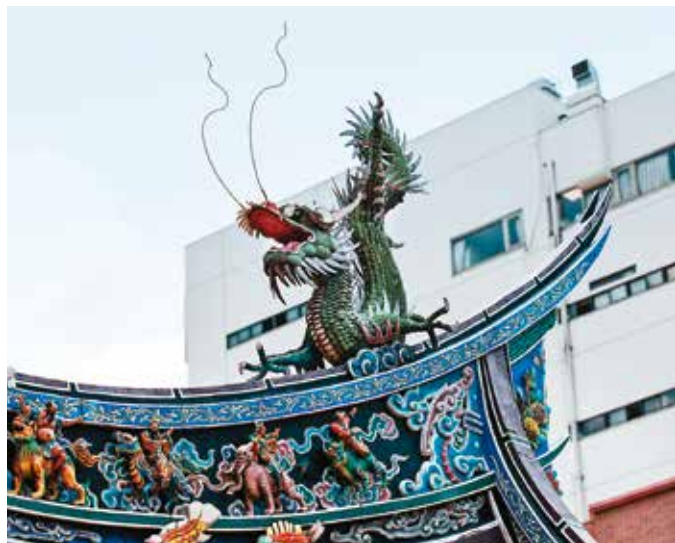
左：渭水驛站常設展「你好，渭水」透過4DViews技術重現蔣渭水的立體影像，解說這位民主鬥士的精彩故事。 右：仔細端詳台北霞海城隍廟的屋頂正脊，可見精細的剪黏裝飾。