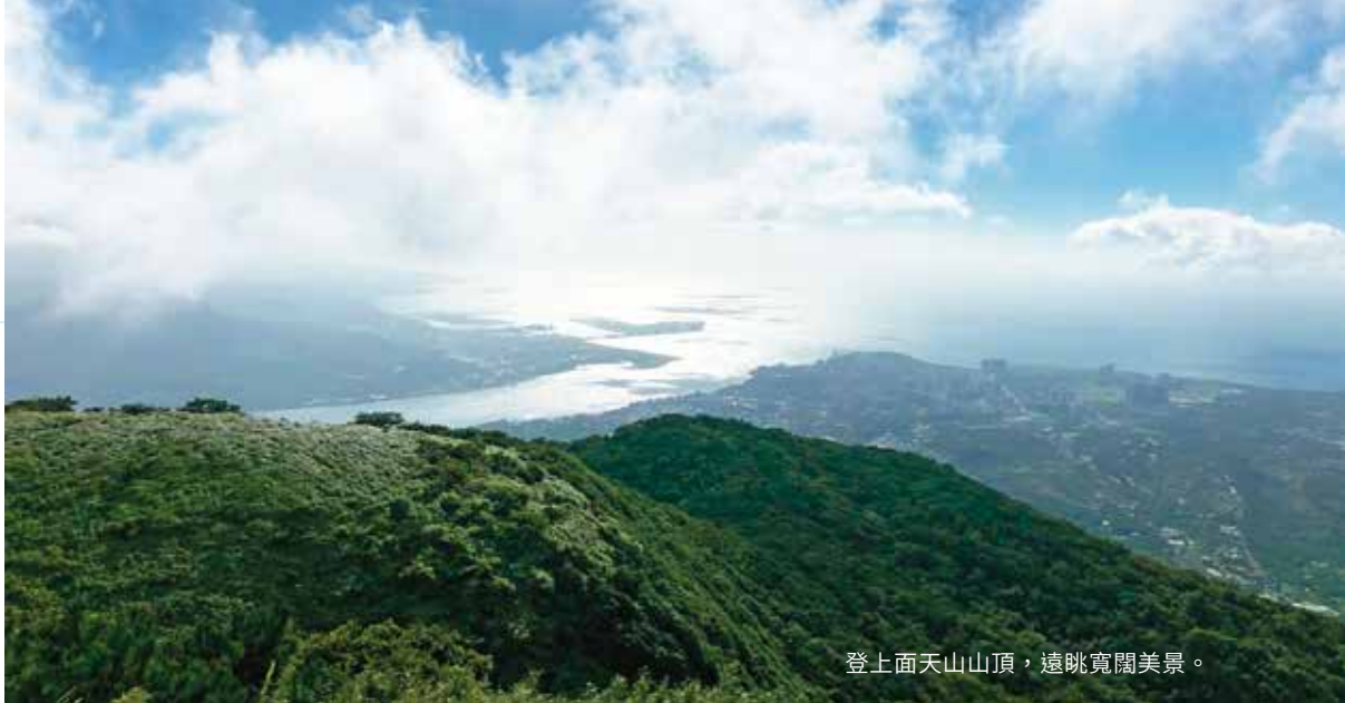
登上面天山山頂，遠眺寬闊美景。