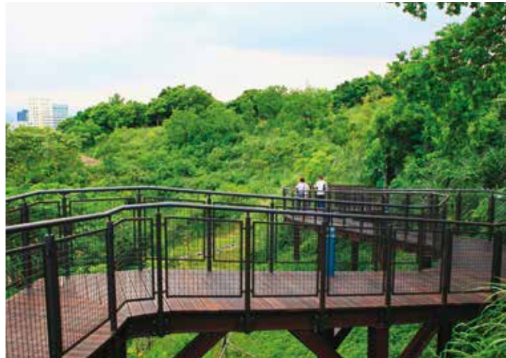
文山森林公園的「趣探險之丘」，規畫攀岩場、超長滑梯等令人玩興大開的遊具，公園深處並設有天空步道，在都市裡即可享受森林芬多精。