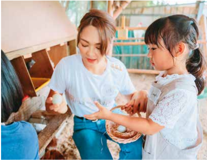
親子一起撿雞蛋，把好吃又營養的蛋帶回家。

樹、小花蔓澤蘭、大花咸豐草等自然產出的食物，都是為了讓參與者理解到，當人們以天然食材餵養雞隻，雞就會活得很健康，並產出營養好蛋來回報我們。過程中隨野家也發揮機會教育，告訴孩子這片土地原本因外來種小花蔓澤蘭恣意生長，在地居民不堪其擾，不過在隨野家採摘它作為雞飼料後，不僅蛋雞有了喜愛的食物，也有助於平衡地力，解決了當地因植物蔓生所帶來的困擾，孩子也因而了解生態界有其自然法則。