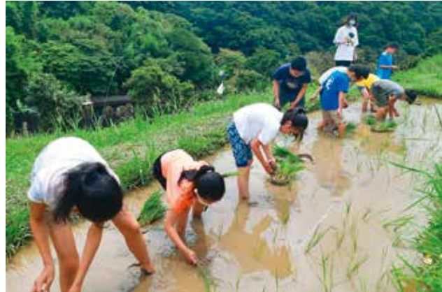
下田插秧感受農事辛勞，了解惜食的重要。

若還想玩味更多農事趣遊，可至台北市農業主題網「食農探險隊」專區，尋找全家喜歡的農遊一起體驗。專區列有15家體驗型農場，提供各種利用當地農作素材的手作活動，從菜田、果園、花室、稻作、製茶，甚至蜂蜜、烘焙、生態遊程應有盡有，不僅可讓全家大小沉浸在夏日田園，也可認識台北在地農業、飲食文化的特色，親近良田所孕育的美麗生態，讓友善土地的觀念透過遊戲體驗深耕孩子心中。❏