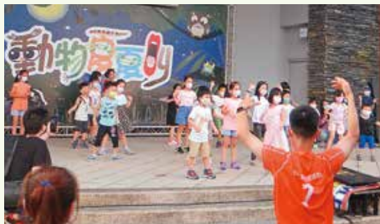
動物舞蹈帶動跳深受小朋友喜愛。

活動期間每週六園區大門廣場、大貓熊館、昆蟲館、兩棲爬蟲館、無尾熊館、教育中心及台灣、兒童區等鄰近主軸步道的展區，將延長開放時間至晚上9時，下午4時後入園，更只需星光票30元；下午5時起，大門廣場主舞台的活動包羅萬象，從動物知識有獎問答、藝文表演、動物舞蹈帶動跳到保育紀錄片播映等，亦邀請國立自然科學博物館、特有生物研究保育中心、社團法人台灣野灣野生動物保育協會等二十餘單位參與野保市集，推廣野