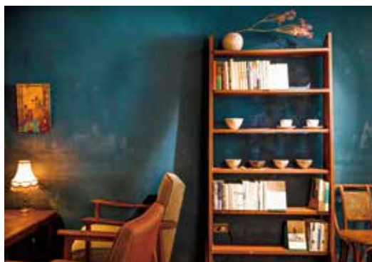
左：「幻孫家咖啡」精心烹製咖哩，力求保持料理與咖啡的風味平衡。 右：疏密有致的空間陳設，能感受到幻孫家主理人的生活美學。