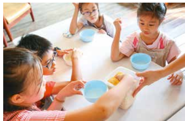
小朋友在「隨野家」親手準備天然雞飼料。

隨野家的蛋雞採取友善放牧，牠們可以在室外空間自由跑跳；而在與牠們接觸前，農場主人們會帶小朋友親手準備雞飼料，只見小碗中放入乾玉米粒、穀粒及構