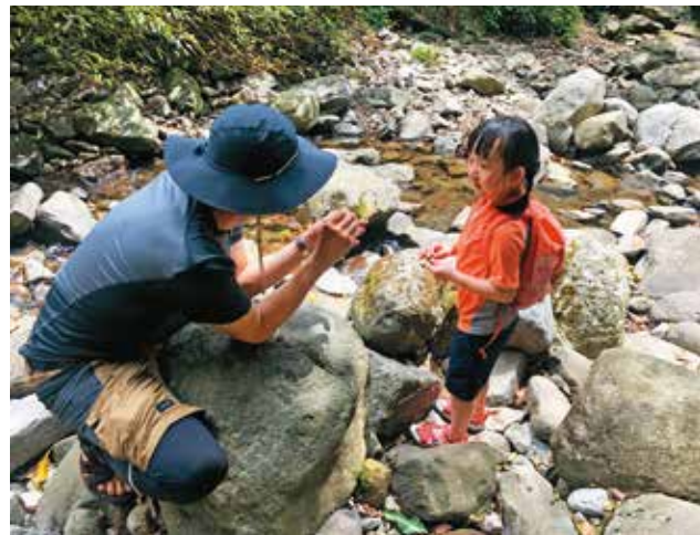
親子健行時可就地取材製造玩具，為行程平添樂趣。

此外，「就地取材」製造歡樂也是不錯的方法。登山時，晨爸會沿路撿拾樹枝並稍作修整，讓它化身為哈利·波特的魔法棒，和他們一同遊戲。晨晨自己也會在路上找一些「玩具」自得其樂，「過了3歲，我就讓晨晨練習自己走。她4歲時攀登嘉明湖，整條路上拎著撿來的小石頭當作手斧，一路上想像自己是建築師，敲敲打打就走到終點了。」晨爸笑說，邊走邊玩就是他們一家登山健行最大的樂趣和收穫。