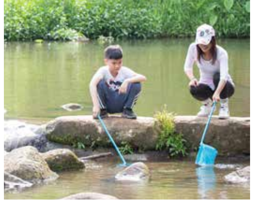
大溝溪生態治水園區內有清涼小溪可以戲水。

聊到與孩子一起到戶外戲水，可大王首推交通便利的「大溝溪生態治水園區」，只要搭捷運到大湖公園站，即可展開一整天豐富的親子旅行。他分享，「大溝溪生態治水園區步道平坦好走，緊鄰清涼小溪，可以帶著孩子們泡泡腳、追小魚；另有大片草皮適合野餐，非常適合踏青。」路上也不時和台灣藍鵲、蛇、松鼠、豆娘等動物、昆蟲相遇，多樣化生態讓這裡成了令人驚喜的大自然教室。