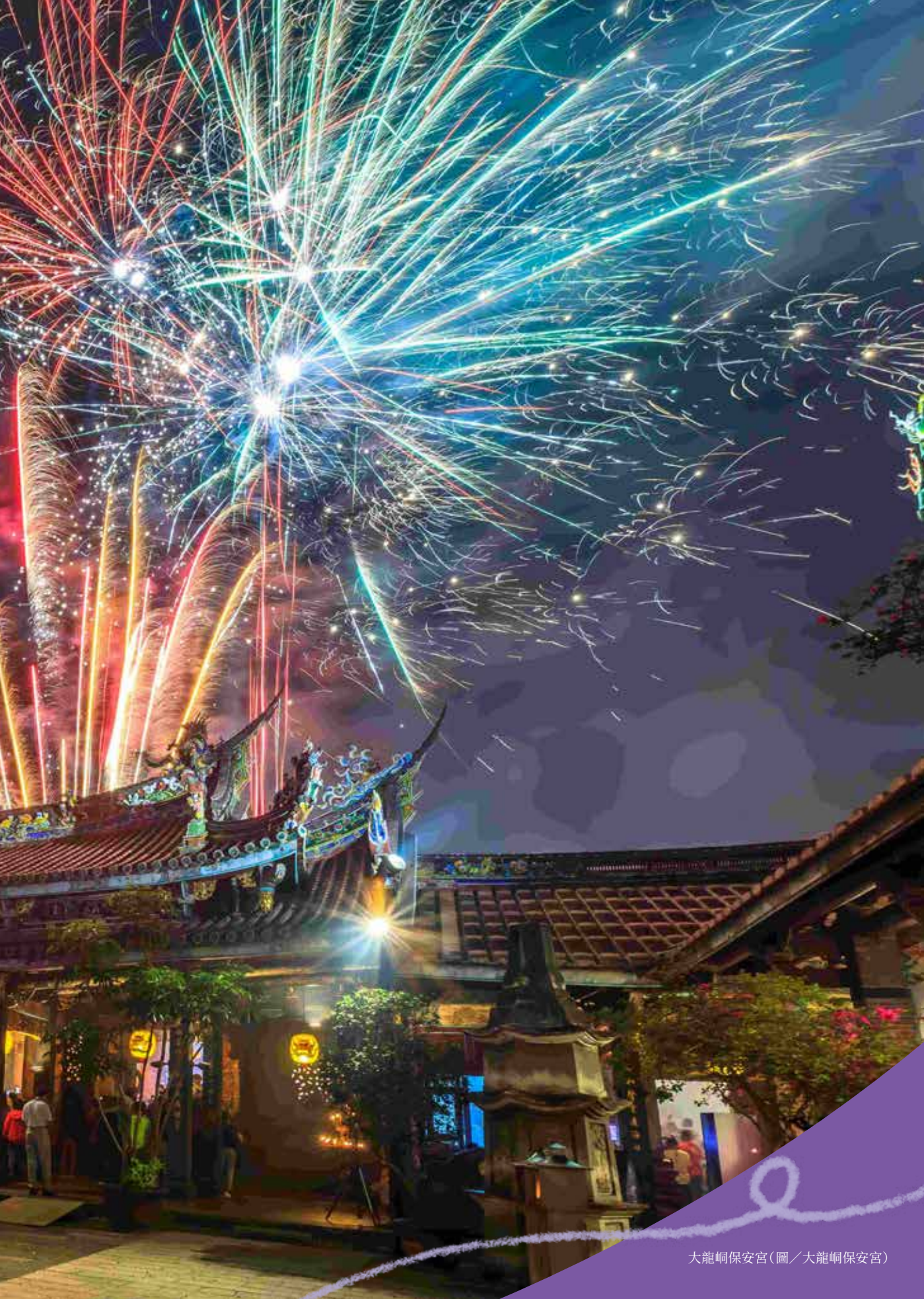
大龍峒保安宮(圖/大龍峒保安宮)