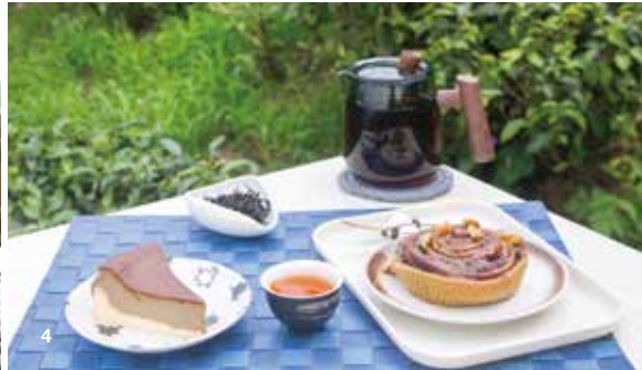
2. 貓空的茶園提供製茶體驗，讓旅客更了解當地茶文化。(攝影／何宗昇) 3. 台北市木柵區農會青年農民聯誼會會長張欣柔分享貓空豐富的茶食文化。(攝影／林煒凱) 4. 甜而不膩的茶香肉桂捲搭配鐵觀音紅茶，十分對味。(攝影／林煒凱)