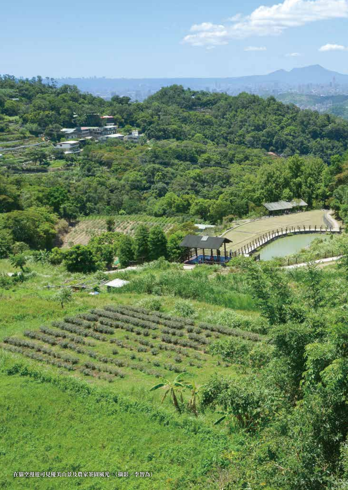
在貓空漫遊可見優美山景及農家茶園風光。