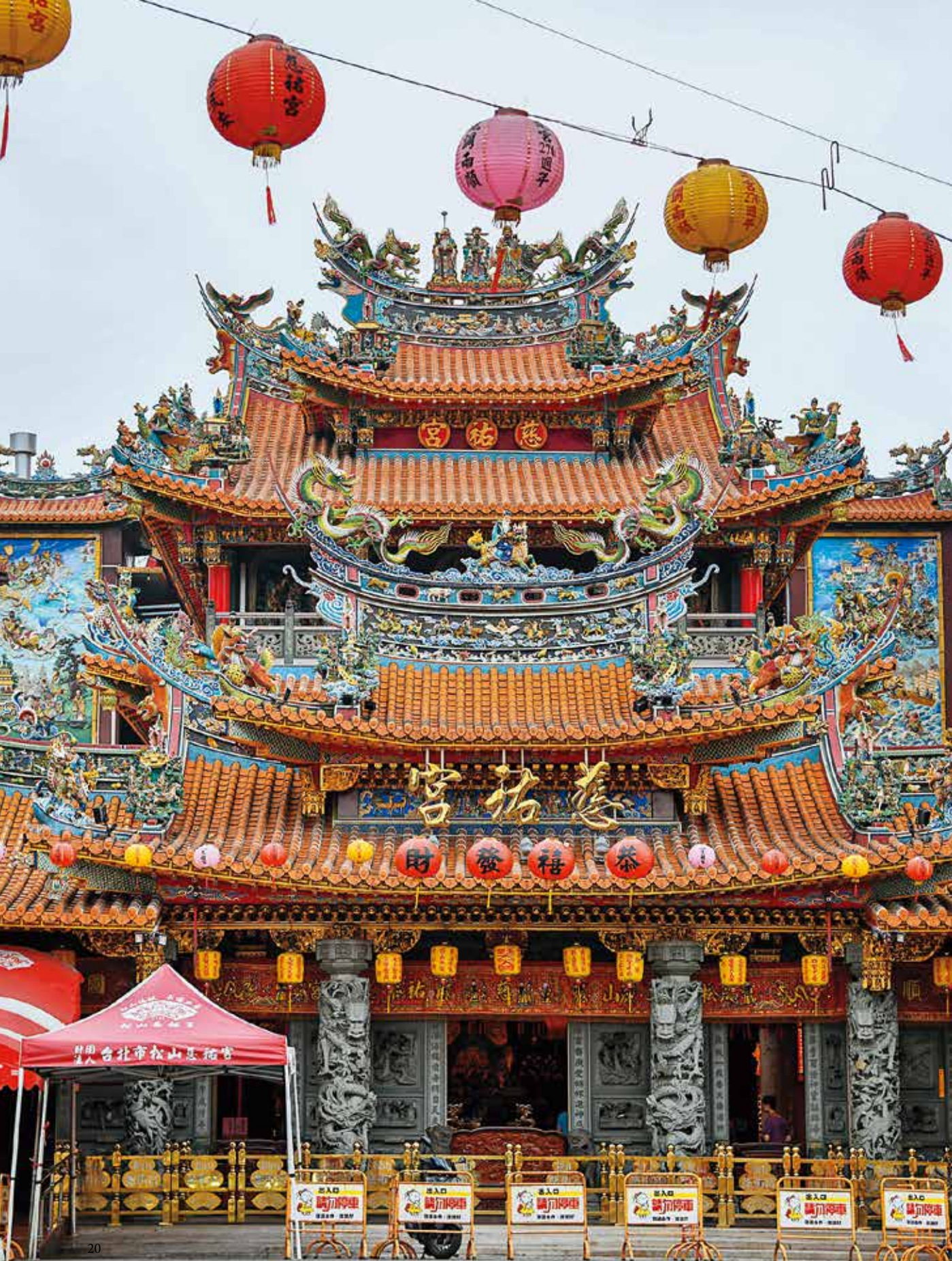
松山慈祐宮是在地重要信仰中心。