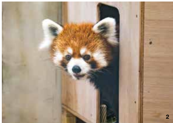
1. 臺北市立動物園與國際合作推動馬來貘的域外族群保育。2. 來自日本的小貓熊「未來」於今年結束檢疫，正式加入臺北市立動物園小貓熊大家庭。

例如將於5月17日試營運的「瀕危故事館」即透過舉辦特展，傳達生命教育及動物園的價值；另配合6月2日世界環境日，在園區舉辦螢火蟲之夜，帶領民眾觀察園內生態。此外，動物園將與木柵貓空地區在地單位合作，結合藝術、宗教及自然生態等元素，共同推動「里山川」文化公共藝術計畫。