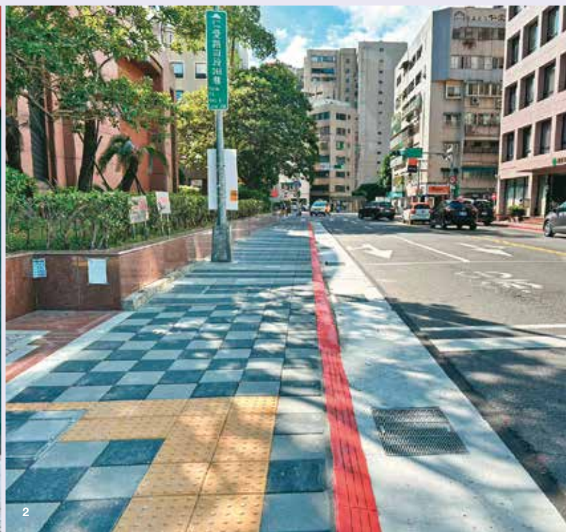
1. 台北市政府透過挖設機車停車彎，避免人車爭道。 2. 台北市政府將標線型人行道改為實體人行道，提升行人交通安全。

於今年推動交通安全年計畫，從工程、教育、宣導、執法、監理五大面向多管齊下，建構更扎實的交通安全基礎。