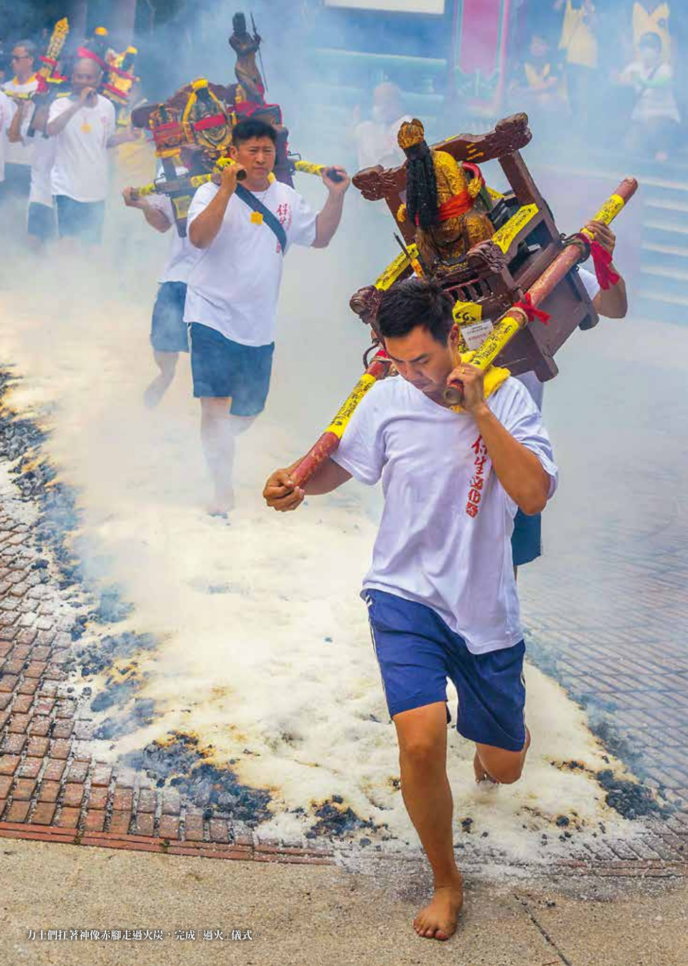
力士們扛著神像赤腳走過火炭，完成「過火」儀式。