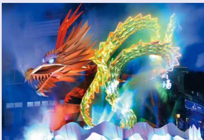
《光龍飛舞慶元宵》捕捉主燈的璀璨光影。

由台北市北門相機商圈發展協會主辦的「台北燈節趣味創意攝影比賽」，響應「2024 台北燈節」，邀請攝影愛好者捕捉創意十足的街區燈景，以及遊客賞燈的歡樂氣氛，透過本屆獲獎作品，也讓人再度回味賞燈的美好時光。