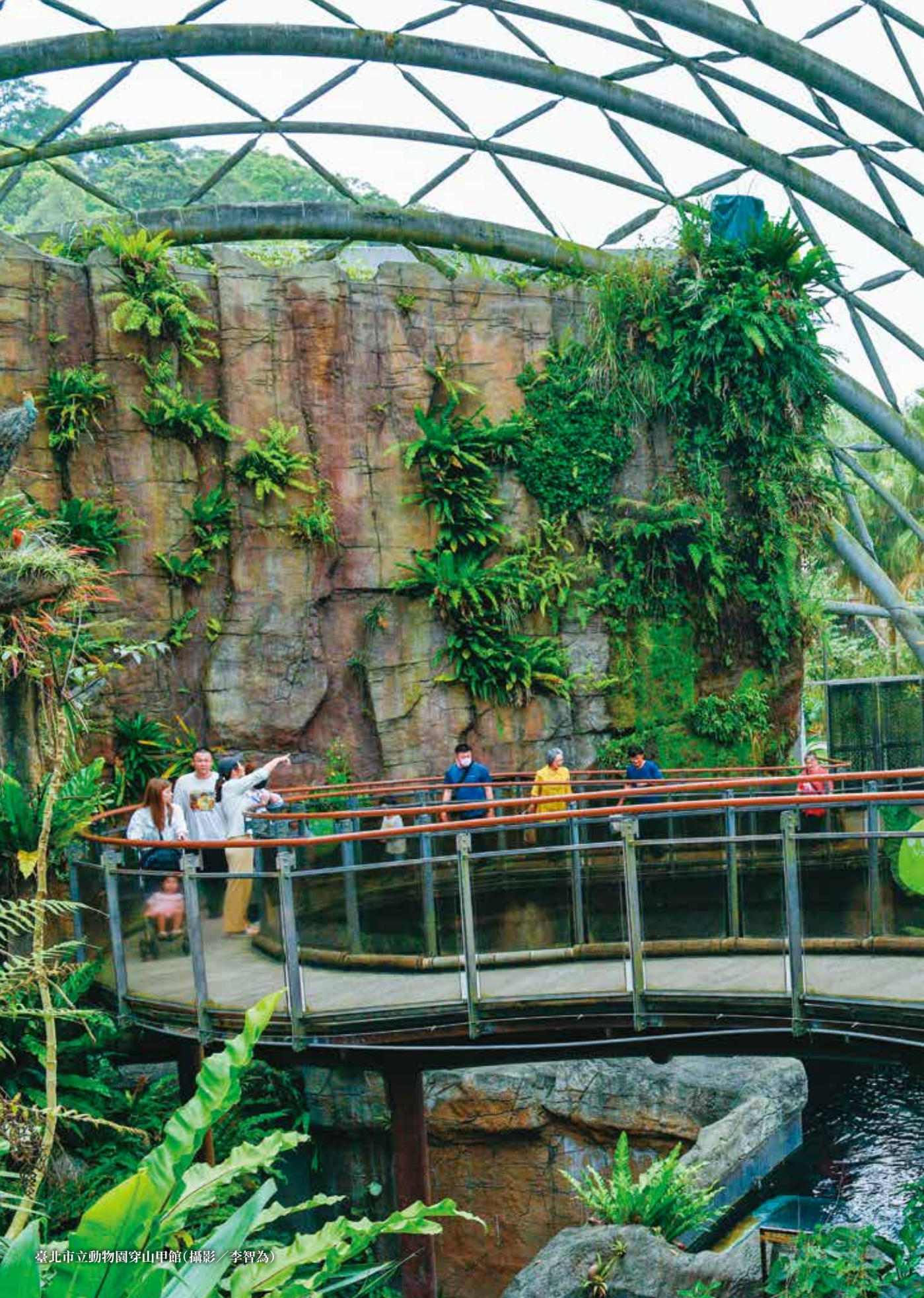
臺北市立動物園穿山甲館