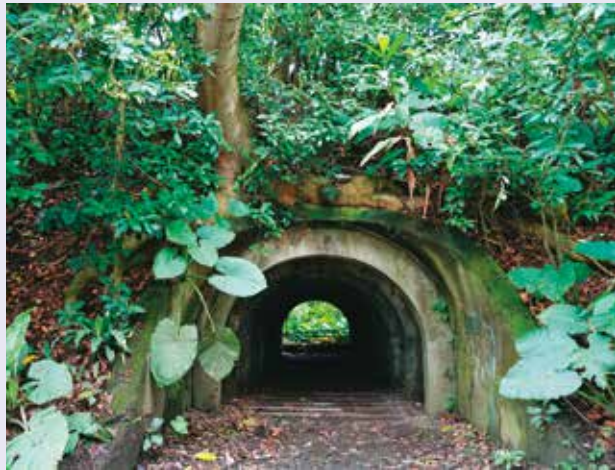
富陽自然生態公園的軍事涵洞遺址。

喜歡探索在地文化的民眾，則可走訪「北投中心新村」及「嘉禾新村」，前者是全台唯一的溫泉軍醫眷村，保留不同時期的聚落建築群，可從中感受過往的生活氣息；後者則從日本時代的日軍砲兵聯隊營房基地，轉變為戰後的軍法組辦公空間及眷村，見證戰爭時代的地景變遷。