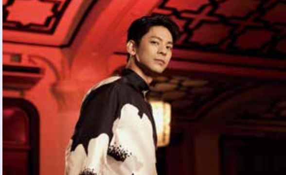
林柏宏擔任2024台北電影節影展大使。

李亞梅也坦言，電影市場在疫情衝擊後尚未完全復甦，又面臨OTT平台興起的挑戰，必須更積極思考轉型，因此北影增加了更多樣的產業及周邊活動，希望更多人從不同角度「看」電影，創造北影的不可取代性。