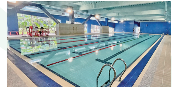
大安運動中心泳池引進「泳池防溺偵測系統」提升泳客使用安全/台北市體育局

在台北，運動除了可以賺健康，還能賺優惠！只要下載「U-Sport臺北樂運動」App並完成註冊，至U-Sport合作運動場館運動即可累積「U幣」，於今年7月31日前完成12次運動集點可參加第一波抽獎，11月30日前完成24次運動集點，即可參加第二波抽獎，獎項包括電動機車、自行車、運動手錶等總價值200萬好禮。想了解更多，請上「臺北樂運動」活動官網查詢。