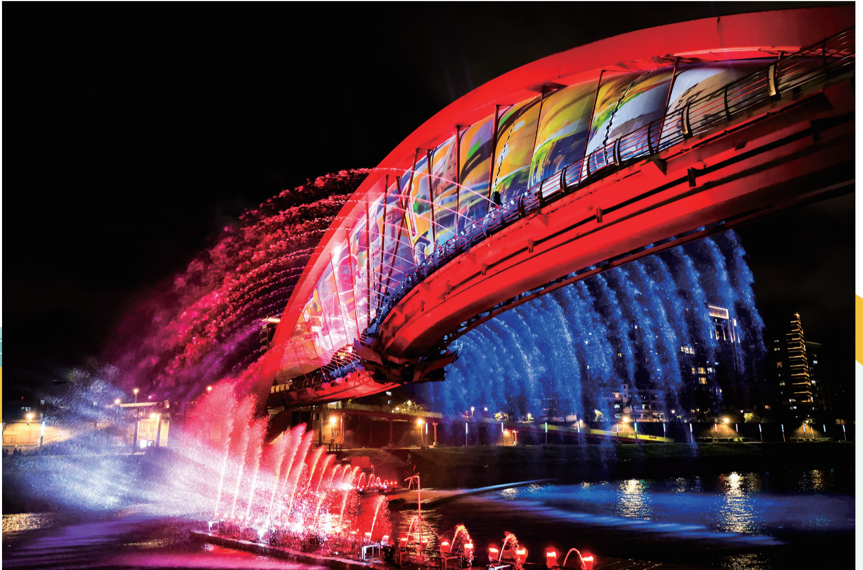
色彩炫麗的水舞光雕秀