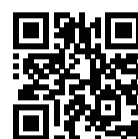
2024臺北國際龍舟錦標賽