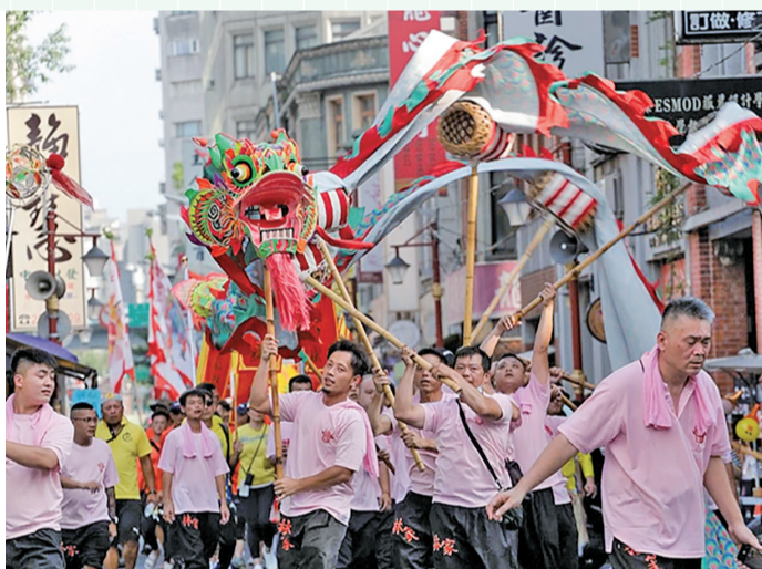
「迎城隍」是大稻埕每年的年度盛事/台北霞海城隍廟

大稻埕年度盛事「台北霞海城隍文化節」於6月1日至30日精彩登場，第一週由「成年禮」和「龍舟祭江・巡遊稻埕」展開序幕暖身，第二週則是由「香火non-stop永續市集」和「島語音樂會」來聚集人氣，而6月整個大稻埕都是「回稻未來-誕隍祭特展」展區，從在地店家到台北地下街展出油畫、文創裝置等多樣主題，讓市民同享為城隍祝壽的歡樂氣氛。