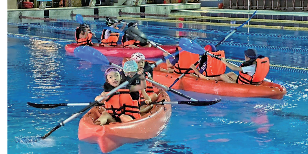
台北市多個運動中心提供12歲以下孩童的運動課程