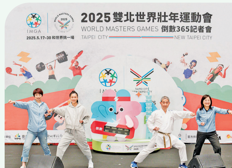
「2025雙北世界壯年運動會」倒數鐘以吉祥物手持「能量電池」呼應充滿運動能量