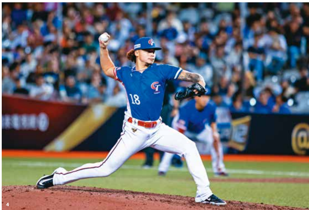
4. 2024 世界 12 強棒球錦標賽預賽，台灣 VS. 多明尼加