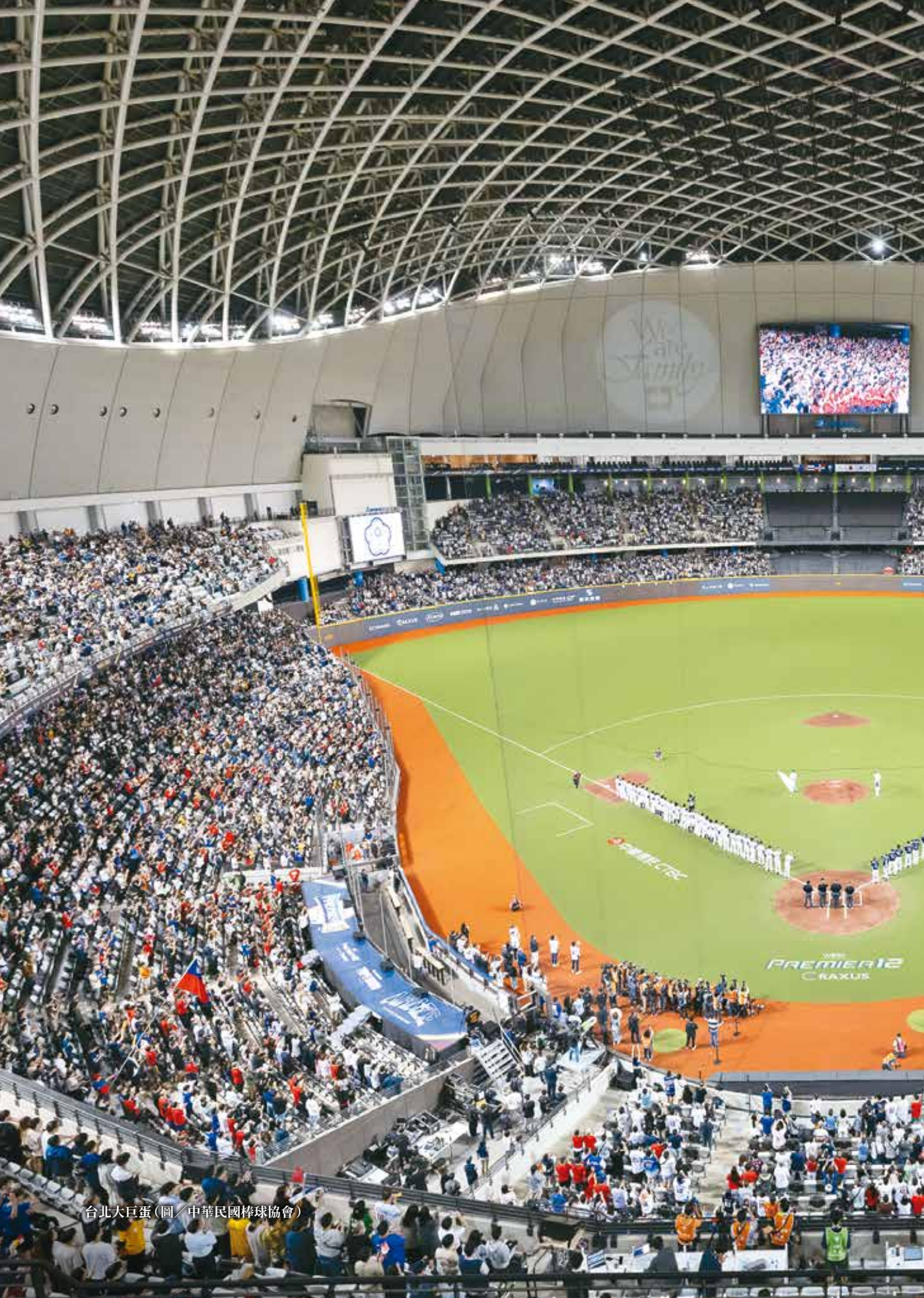
台北大巨蛋