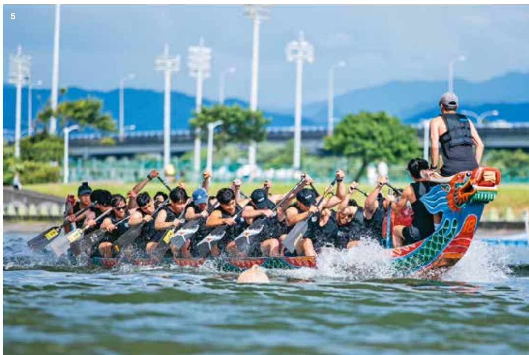
5. 2024 台北國際龍舟錦標賽