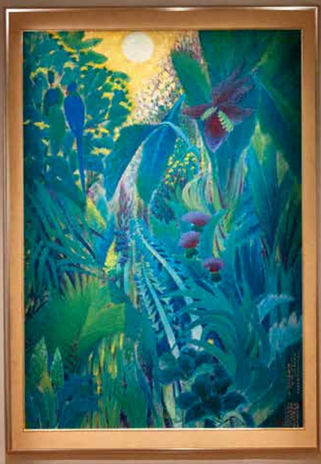
「喧囂的孤獨：臺灣膠彩百年尋道」展呈現台灣膠彩畫繽紛多元的樣貌。