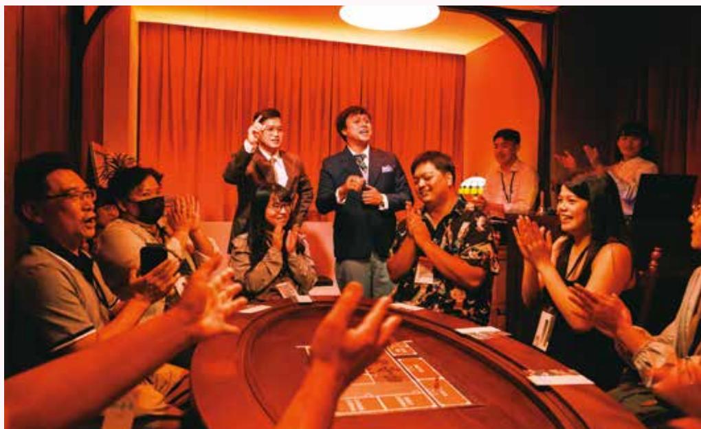
山賊製作設計與北投老爺酒店合作推出結合桌遊與劇场的表演節目《天亮前的那卡西》，帶給民眾深度的北投文化體驗。

蔡詩萍說明，北市府雖想依循影響力投資的形式注資文創業者，但由於法規上政府機關尚無法直接扮演「投資者」