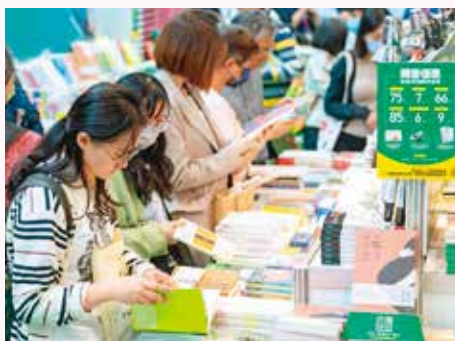
台北國際書展邀請民眾進入廣袤的閱讀世界。 (資料照)

除主題館外，本屆書展共規畫文學書區、專題書區、綜合書區、童書區、動漫輕小說書區、數位出版及學習區、國際書區、外文書區等，並邀請義大利作家大衛·卡利、日本直木賞作家中島京子及《100層樓的家》作者岩井俊雄等知名