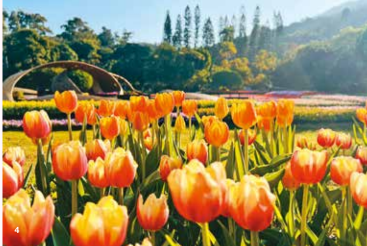
3. 陽明山前山公園的紫藤花將春日點綴得更加浪漫。(資料照) 4.「士林官邸鬱金香展」以鮮豔的鬱金香花海，營造歐洲春日風情。(資料照)

主題所創作的畫作。無論是茶花愛好者，或是尋求心靈寧靜的旅人，這裡都是不可錯過的去處。