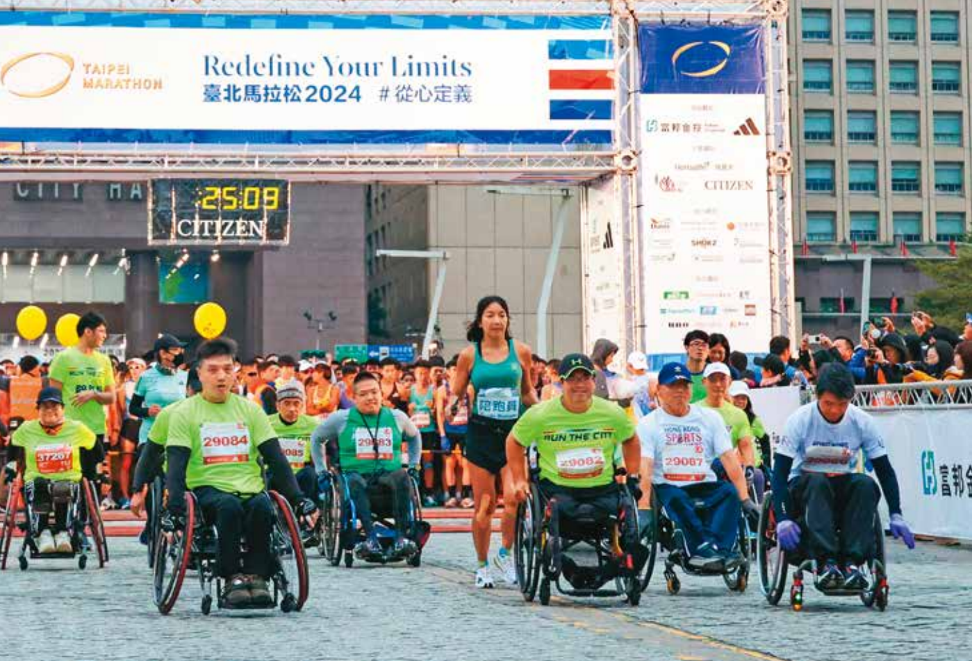
「台北馬拉松」輪椅組選手突破身體侷限，在賽事中挑戰自我。

館是否有無障礙廁所、無障礙電梯及出入口動線的便利性等，都是身障朋友關心的重點。除了場館需符合無障礙空間規範，周邊交通設施的完善程度同樣重要，例如增設鄰近運動場館的公車站點或增加低底盤公車班次等，能提供身障者自主活動的環境，將有助於提高他們外出運動的意願。