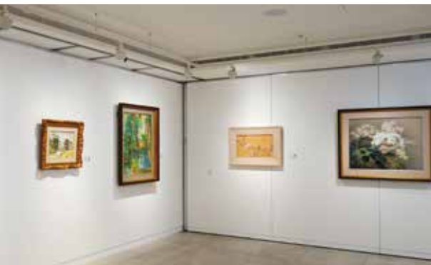
順益台灣美術館展出影響台灣畫壇深遠的藝術家之作。

京町8号所在建築是興建於1930年代的街屋，店名即源自所在地京町四丁目8号。建築現仍保留磨石子牆面、日本傳統障子式落地窗、鑄鐵水龍頭等元素，別具老宅懷舊風情，在室內啜飲咖啡之際，也能感受台北城的歷史風華。