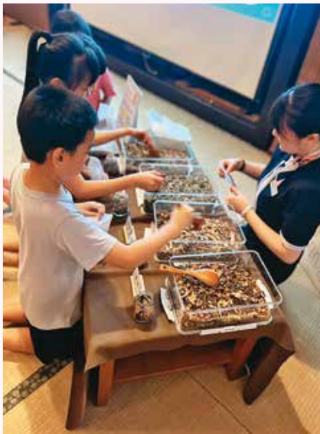
「紀州庵文學森林」與企業合作舉辦中藥體驗與相關課程，是文創永續發展的案例。

的角色，因此文創永續培育計畫由北市府「先補助」、搭配文策院「後投資」的整合機制，未來將創建僅需要提交一次申請書的綠色通道，讓文創業者有效率地獲得從「補助」到「被投資」的充足資金鏈。