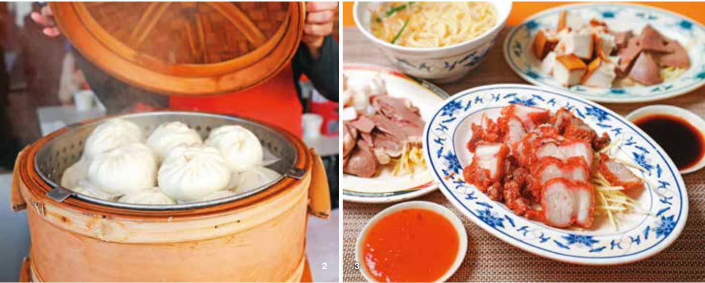
2.「妙口四神湯肉包專賣店」剛蒸熟的包子熱煙蒸騰，是在地人氣小吃。3.「賣麵炎仔」的紅燒肉、黑白切和切仔麵，組成一頓豐盛的台式早餐。

而位於重慶北路巷弄沒招牌的福州麵店，乾麵佐以濃厚的蒜香與醬油，是福州移民對家鄉的懷念。店內的黑白切配料雖簡單，卻