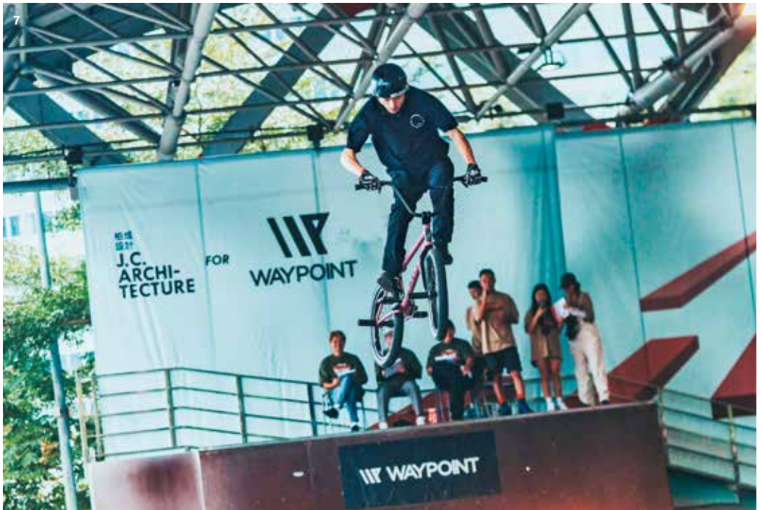
7. 2023 台北市極限運動大賽