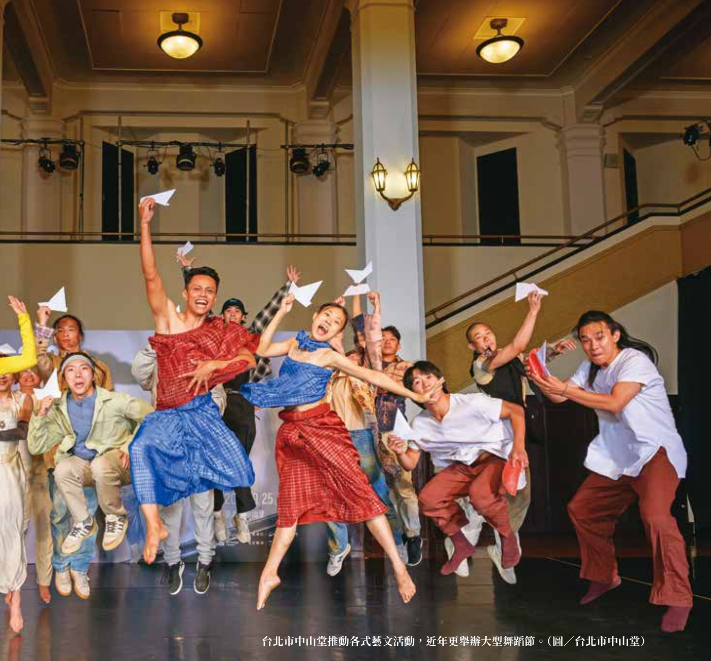
台北市中山堂推動各式藝文活動，近年更舉辦大型舞蹈節。

術館」特展，以「城中轉身術」為主題，展出鄧南光《台北，北門口平交道》、張照堂《萬華I》與龍思良《懷念西門町》等數位輸出展品，可從中窺見台北今昔變遷。同時也邀請當代藝術家開設多場共創工作坊，例如藝術家透過蒐集承載老店與商家回憶之物，並將其印製成桌遊卡牌，與參加者一同探索城市的歷史記憶。