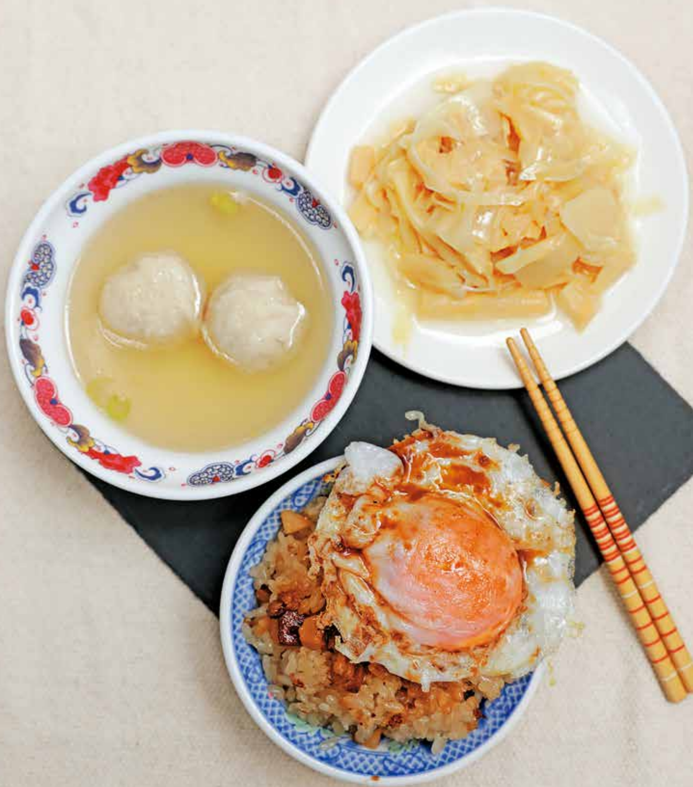
「珠記大橋頭油飯」的油飯鋪上半熟荷包蛋，再配一碗魚丸湯，是老饕最愛的經典組合。