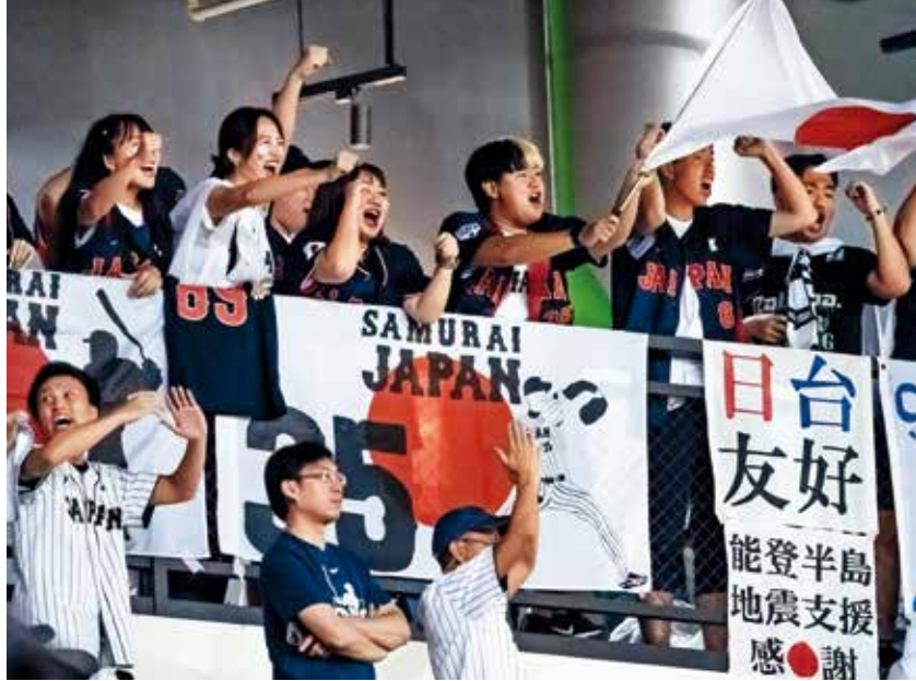
「2024 世界 12 強棒球錦標賽」預賽在台北大巨蛋舉行，吸引國內外球迷到場觀賽。

北世壯運等大型賽事，預計也將吸引國內外選手與運動迷齊聚台北，為這座城市掀起另一波運動旅遊熱潮。