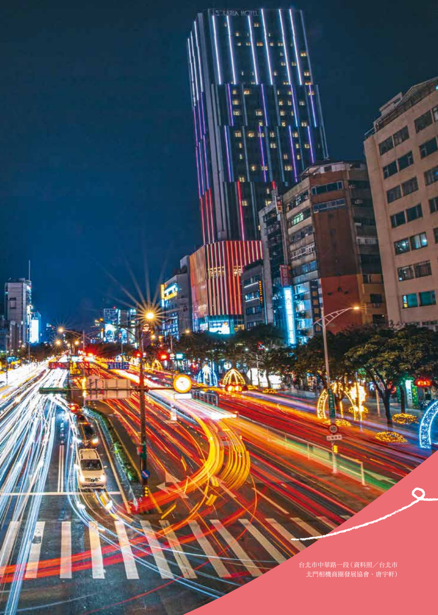
台北市中華路一段