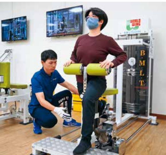
台北市信義運動中心引進「初動負荷訓練器材」，民眾可利用器材伸展骨盆、髖關節及周邊的肌肉。

至於以運動科技設備來提升運動競技表現的運動科學訓練風潮，如今也深入全民共享的運動場域。文山運動中心羽球館即結合智慧科技，運用偵測系統記錄民眾的揮拍軌跡、球速及殺球次數等，並提供科學數據分析，作為民眾精進運動表現的參考。信義運動中心也自日本引進「初動負荷訓練器材」，這項器材可針對細小肌肉進行鍛鍊，並提供更精細的負重選擇，讓民眾可視身體狀況微調訓練強度，有效