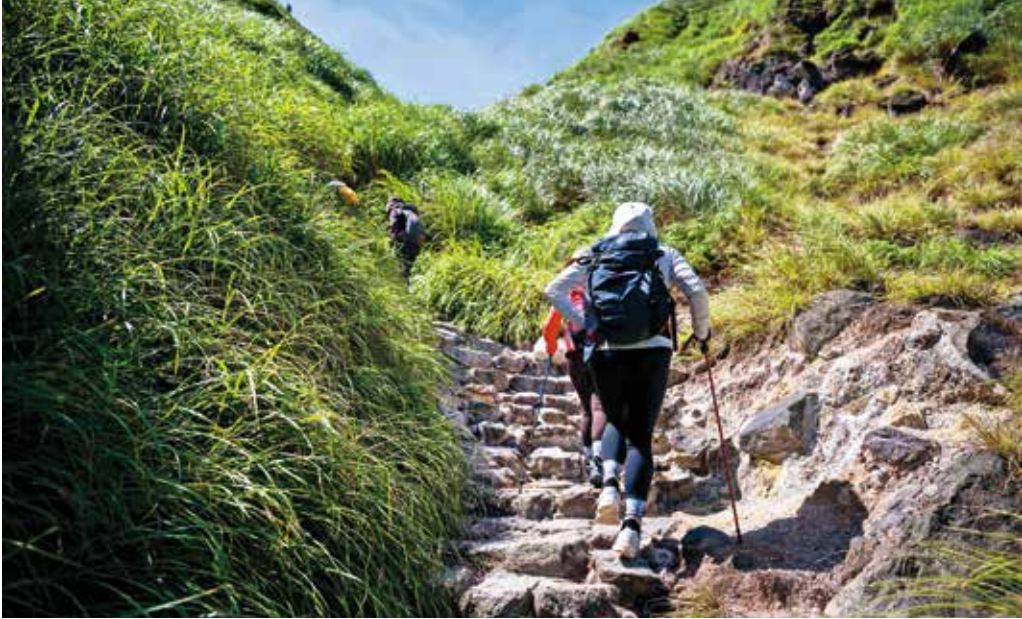
「台北大縱走」串聯台北的山林步道，是登山健行的理想選擇。

跨陽明山國家公園、劍潭山、白石湖、南港山系及貓空等旅遊勝地，也串聯捷運關渡站至動物園站的河濱自行車道，總計長達130公里的路線，融合了台北的山光水色、自然生態及歷史遺跡，為台北絕佳的運動旅遊路線。