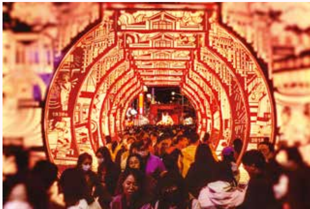
台北燈節期間，民眾可沿著中華路欣賞創意燈飾。

此次特別邀請日本搖滾樂團 GLAY 主唱 TERU 共同創作的「精神淨化」燈組，帶來象徵函館市祝福；另外與音樂人林強合作的「台北留聲機」作品，結合傳統留聲機設計，透過聽覺傳遞燈節獨特的韻味，注入動人的聲音效果。而西本願寺的「祈福燈林」，則在靜謐的氛圍中帶來新年最溫暖的祝福。漫步中華路一段的天橋，由福星國小學童與藝術家布雷克攜手創作的燈籠隧道，如同開啟一場充滿童趣與想像的旅程。在全國花燈競賽展區，傳統花燈之美令人驚嘆，友好燈區則展出來自國際城市的燈組，象徵跨國界的祝福與友誼。