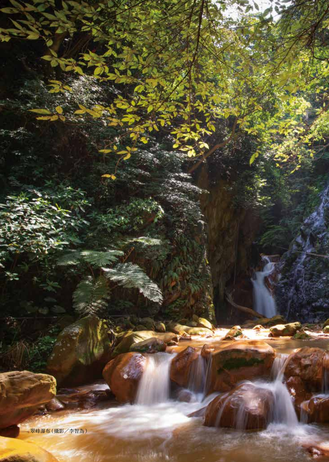
翠峰瀑布