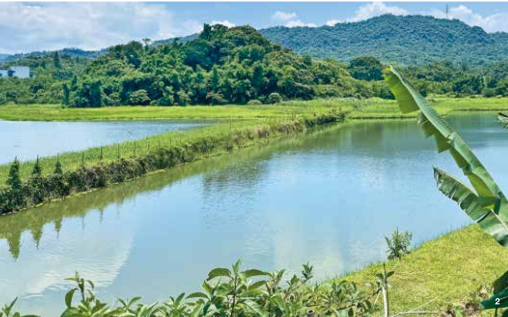
2. 新庄仔埤溼地綠意環繞，是城市中的自然祕境。 3. 新新公園是民眾親近水畔綠意的好去處。