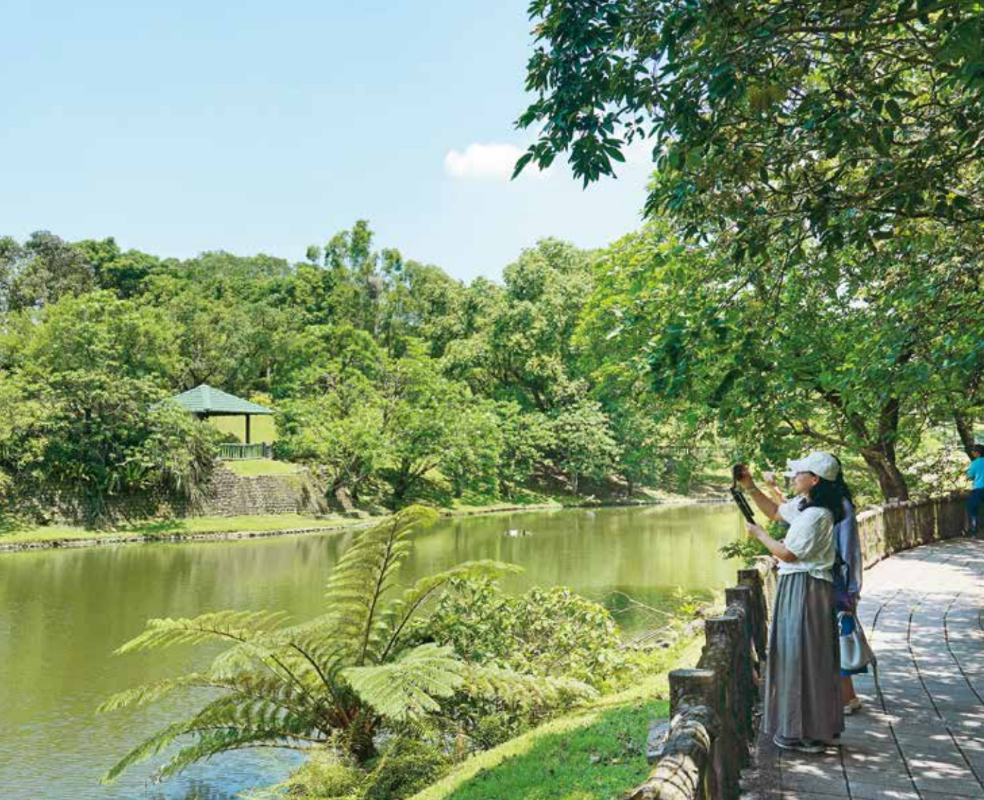
南港公園的環湖步道是旅客遊憩與賞景的絕佳去處。

「氣」、「石」、「木」三處能量場，分別位於籃球場邊、山丘上與樹林間，民眾可在此靜坐休憩。森林冒險兒童遊戲場則以飛鳥、松鼠等動物為主題，設計溜索、樹屋等設施，讓孩子度過美好玩樂時光。