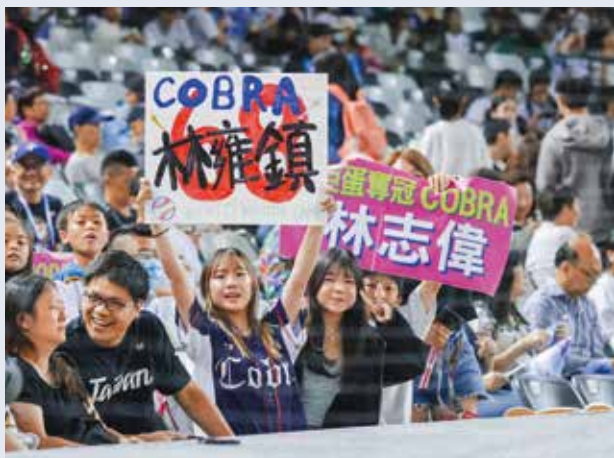
熱情民眾到大巨蛋為選手加油。

的笑容迎接來自世界的選手。」高橋徹特別提及，對於志工們的熱情協助印象深刻，並稱讚這些幕後英雄引導有序，令人佩服。