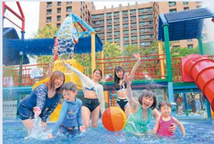
臺北親水節期間，「水鄉庭園」將化身城市中難得一見的水上樂園。

此外，臺北自來水園區將在 8 月 8 日推出「父親節特別優惠活動」，家長帶小孩入園可享同行兩位家長免費優惠，臺北市立圖書館行動書車也會在 8 月 8、9 日進駐園區，