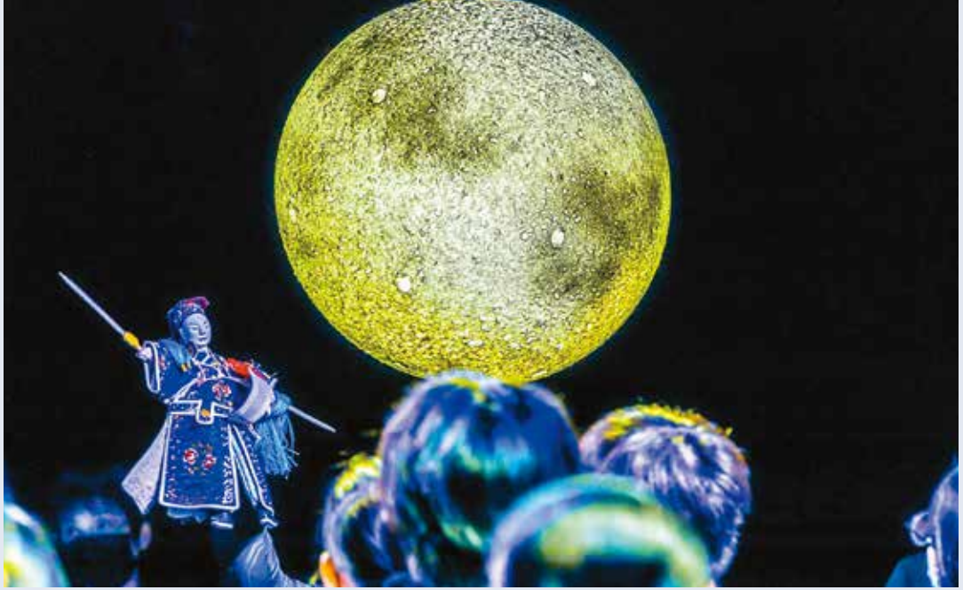
臺北兒童藝術節帶領孩童打開想像的邊界。(圖／臺北表演藝術中心)