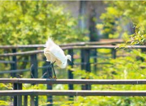
沿著新新公園的水上棧道漫步，可近距離觀察水鳥。

除了生態溼地，也配合園內地形規畫兒童遊戲區，包括以東北角疊山地形為概念設計的攀岩場，以及溜滑梯、溜索、平衡木等設施，讓孩子盡情嬉遊，大人也能放鬆休息，共度歡樂時光。