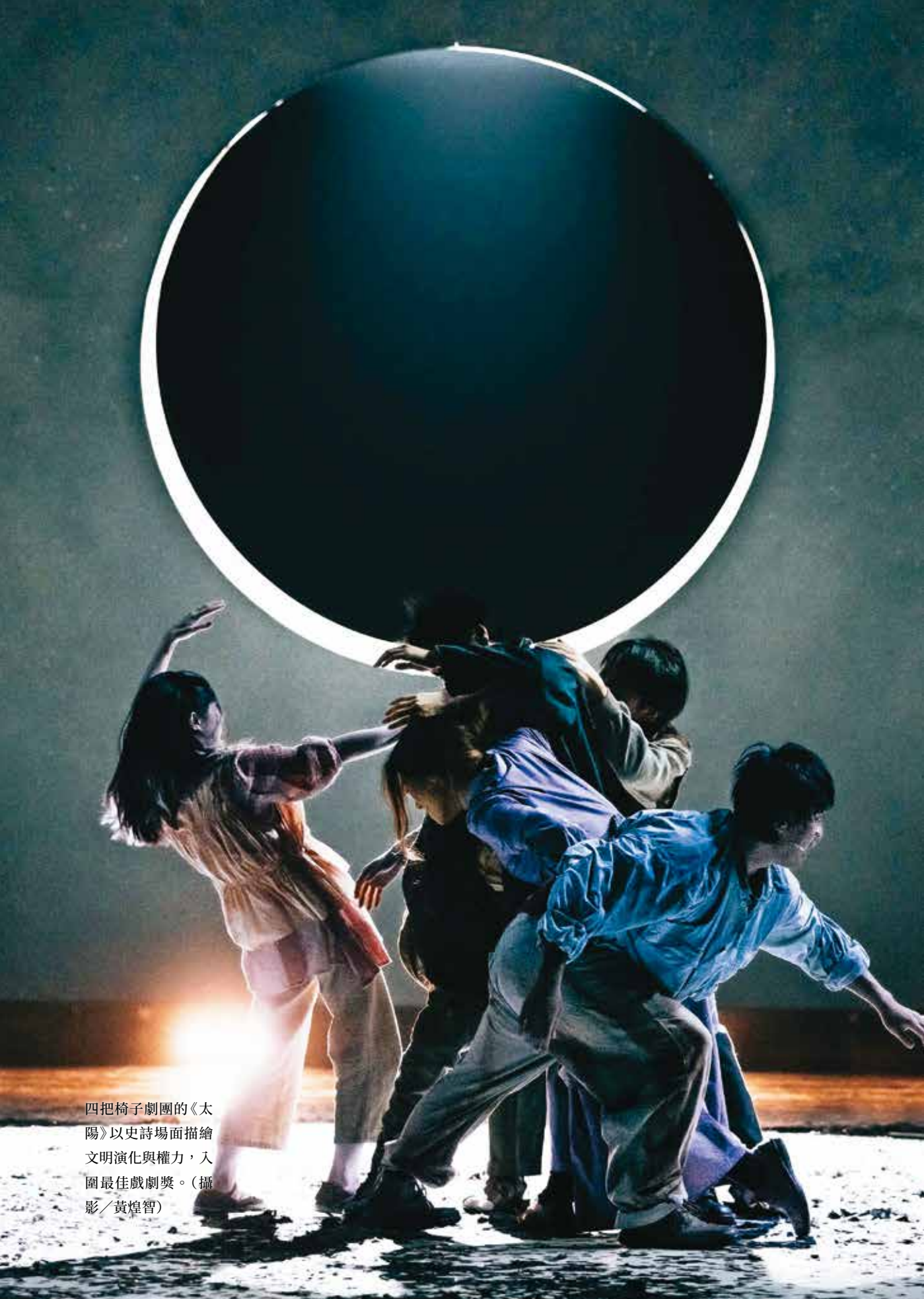
四把椅子劇團的《太陽》以史詩場面描繪文明演化與權力，入圍最佳戲劇獎。