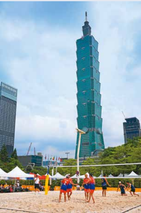
北市府前廣場變身沙灘排球賽場。