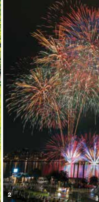
1. 滯洪池改造的金瑞治水園區是休憩與賞景的好去處。 2. 大稻埕夏日節的煙火秀點亮淡水河岸。

友都能挑戰飛岩走壁的刺激感，享受戶外冒險的趣味。張凱堯提醒，攀岩須具備專注力、技術及基本體能，因此使用場地時須注意自身安全、量力而為，才能快樂且安全地享受攀岩樂趣。