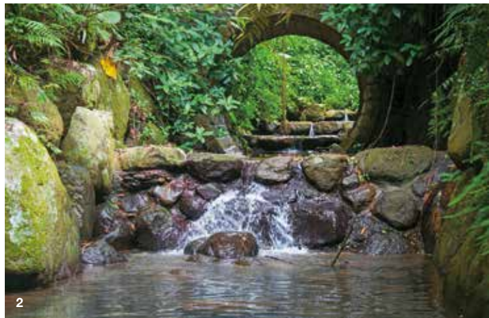
1. 富陽自然生態公園讓人暫離都市喧囂，沉浸在滿山綠意中。 2. 虎山步道的砌石水岸覆滿濃密綠意。