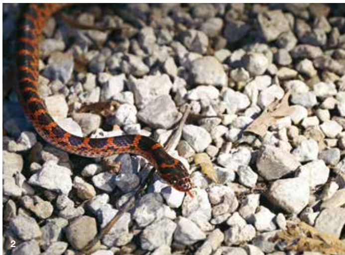
1. 在天母古道夜觀時不妨抬頭留意樹冠，有機會觀察到棲息於枝頭的領角鴞。 2. 天母古道是蛇類多樣性高的區域，夜觀時有機會看見紅斑蛇。