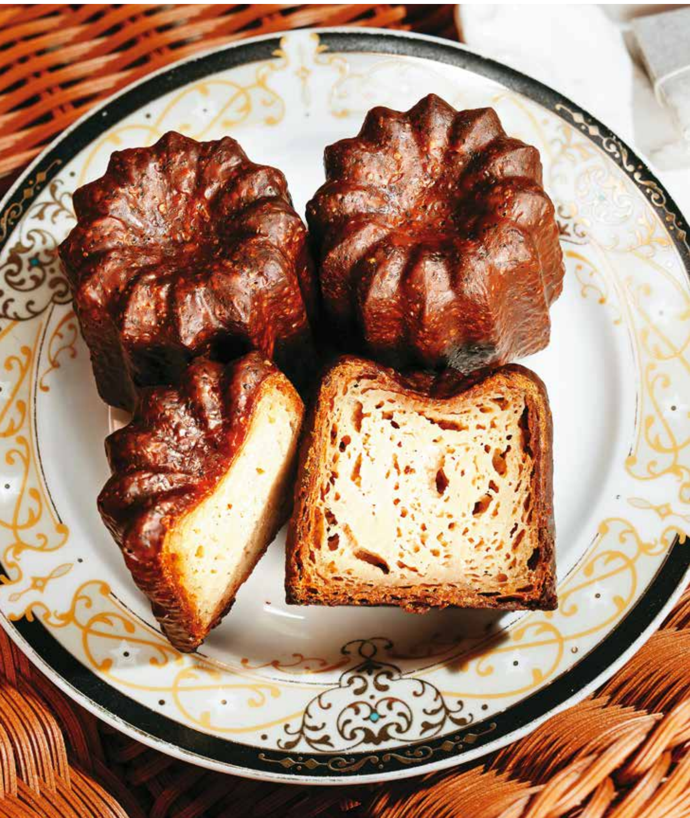
「迷上甜點—可麗露 de 秘密基地」的「伯爵茶可麗露」為融合英倫茶香與法式甜點的佳作。