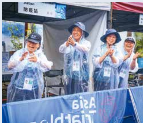
鐵人三項項目場邊熱情加油的志工團。

即將接棒舉辦 2027 世壯運的關西組委會副事務局長高橋徹也分享，許多日本選手曾參加過其他城市主辦的世壯運，但他們一致認為「雙北是最有溫度的主辦城市，不只在賽場上，而是用整座城市