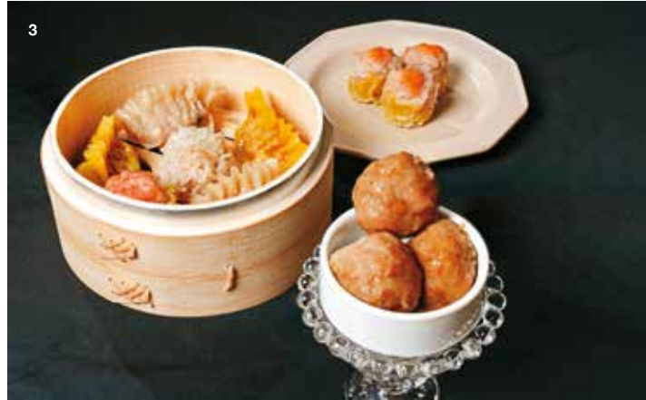
2.「南園食品店」的「五福芋泥粽」以芋泥、紅豆等入餡，滋味軟綿香甜。3.「德慶港點」的「手工牛肉丸」及其他港式茶點，重現香港老師傅的好手藝。

點心詮釋台北的歷史記憶與時代風貌。以湖州粽聞名的「南園食品店」以芋泥、紅豆、花豆、小薏仁與糯米製作的「五福芋泥粽」，展現層次豐富的香甜滋味；「德慶港點」則承襲香港老師傅手藝，以肉質細緻的牛腿肉製成口感彈牙的「手工牛肉丸」，展現傳統市場的職人精神與風味。