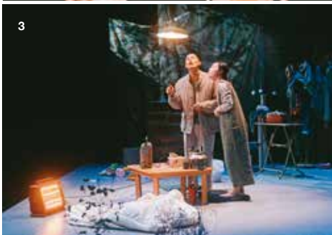
2. 同黨劇團的《父親母親》以布袋戲發展交織白色恐怖與身分認同，入圍最佳戲劇獎。（攝影／唐健哲） 3. 再拒劇團的《沙拉殺人事件》以台語在地化方式詮釋日本荒誕派作家別役實同名作品，入圍最佳獨立精神獎。（攝影／唐健哲）