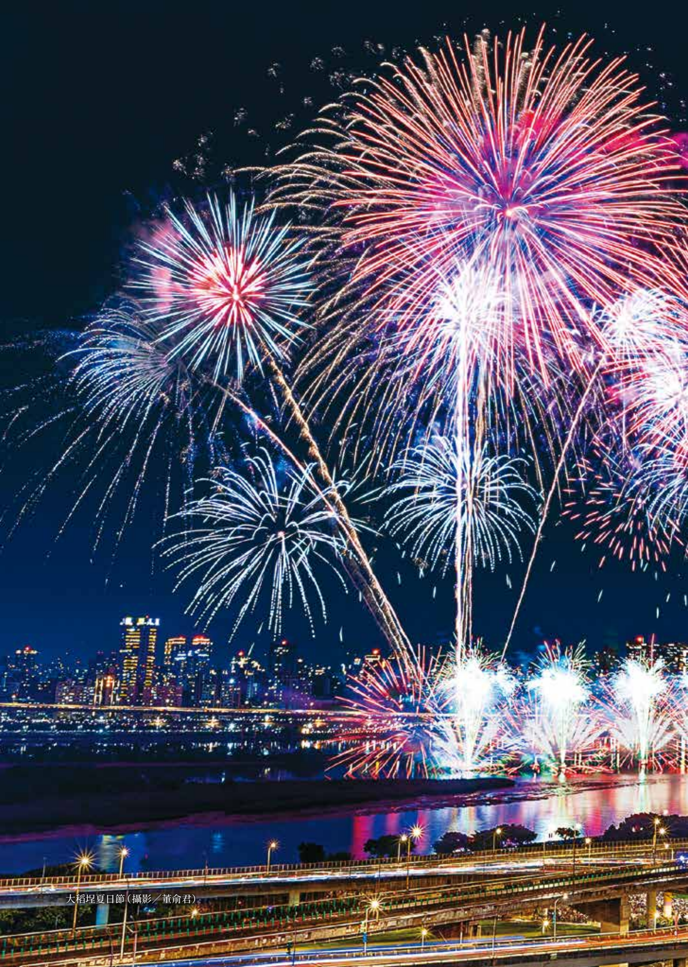
大稻埕夏日節