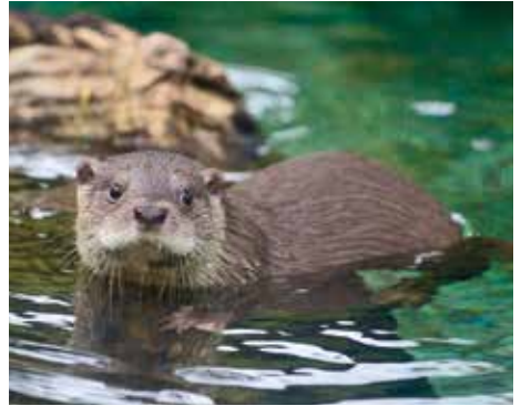
歐亞水獺為臺北市立動物園暑期活動主題動物之一。

除了走進郊野觀察夜間生態，臺北市立動物園暑假週六夜晚亦會化身星光動物園，將多處展區延長開放至夜間，成為夏