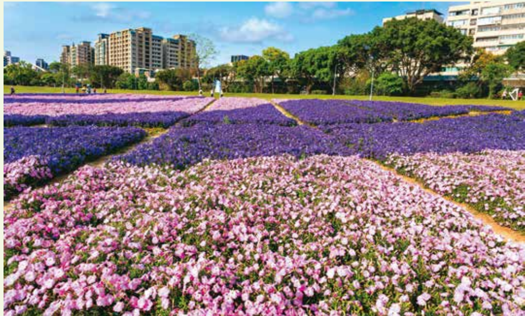
在古亭河濱公園可遠眺整片花海。

在內湖樂活公園則能欣賞日與夜不同風情的花景。寒櫻、八重櫻與吉野櫻在初春接力綻放，白日漫步花徑，可細品櫻花的姿色與層次，夜晚在燈光映照下，花影隨光線輕盈變化，展現櫻花的細膩之美。