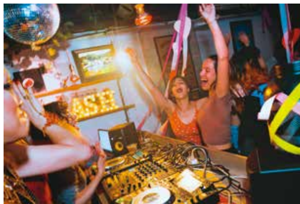
旅客隨著音樂節奏舞動身體，享受派對的熱鬧氛圍。