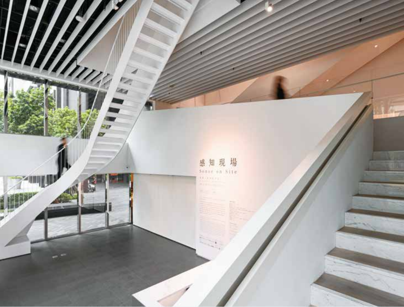
忠泰美術館擅長依展覽主題調整空間設置，曾架設「天井樓梯」打造沉浸式觀展體驗。

其生活與創造的哲學。觀展後亦可走訪鄰近的家居選品店與花坊，在經典家具與花藝作品間，延伸對「家」與未來生活的想像。