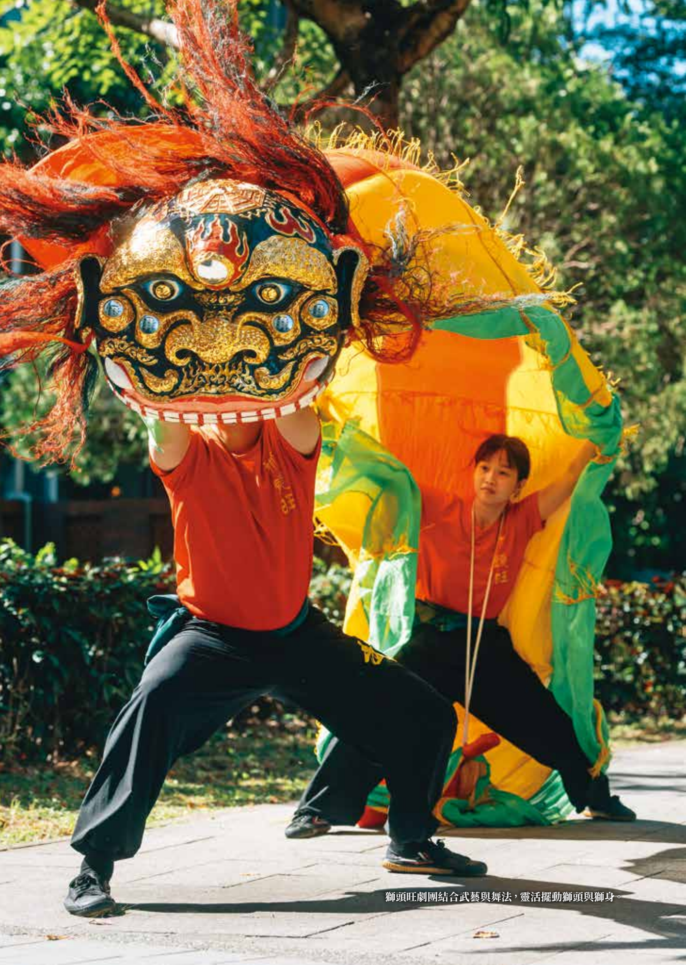
獅頭旺劇團結合武藝與舞法，靈活擺動獅頭與獅身。