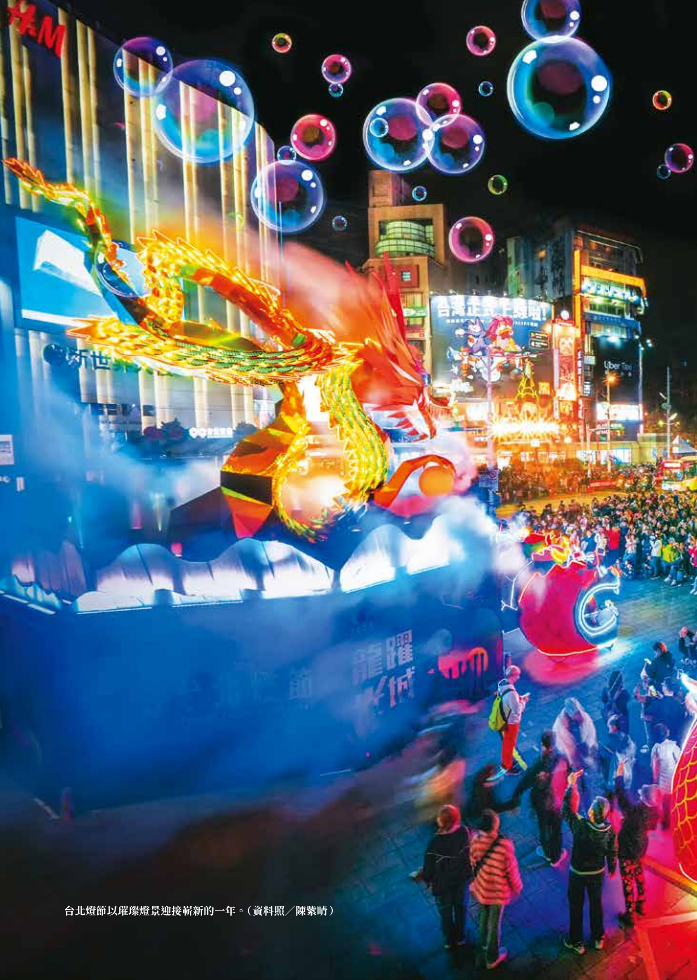
台北燈節以璀璨燈景迎接嶄新的一年。