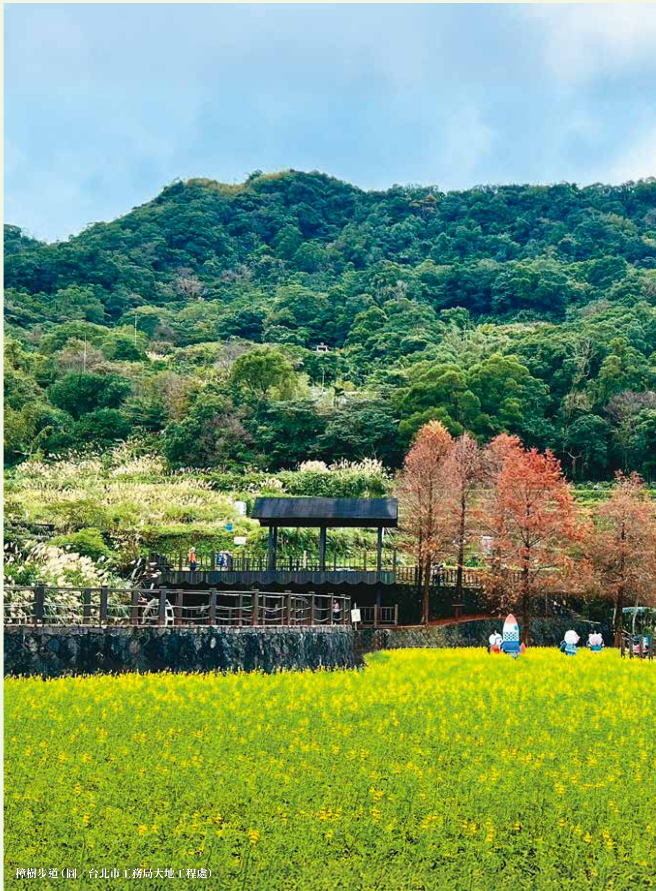
樟樹步道