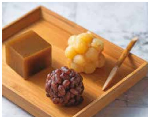
「滋養和菓子」的點心兼具精緻外觀與創新風味。

元宵節除了賞燈，許多人會應景食用具祈福與圓滿之意的元宵。和菓子分享，元宵除了花生、芝麻等傳統口味，在中正紀念堂附近的「國鼎銘點」也能找到玫瑰、桂花等隨外省族群傳入的古典風味，若想品嚐特殊口味不妨一試。