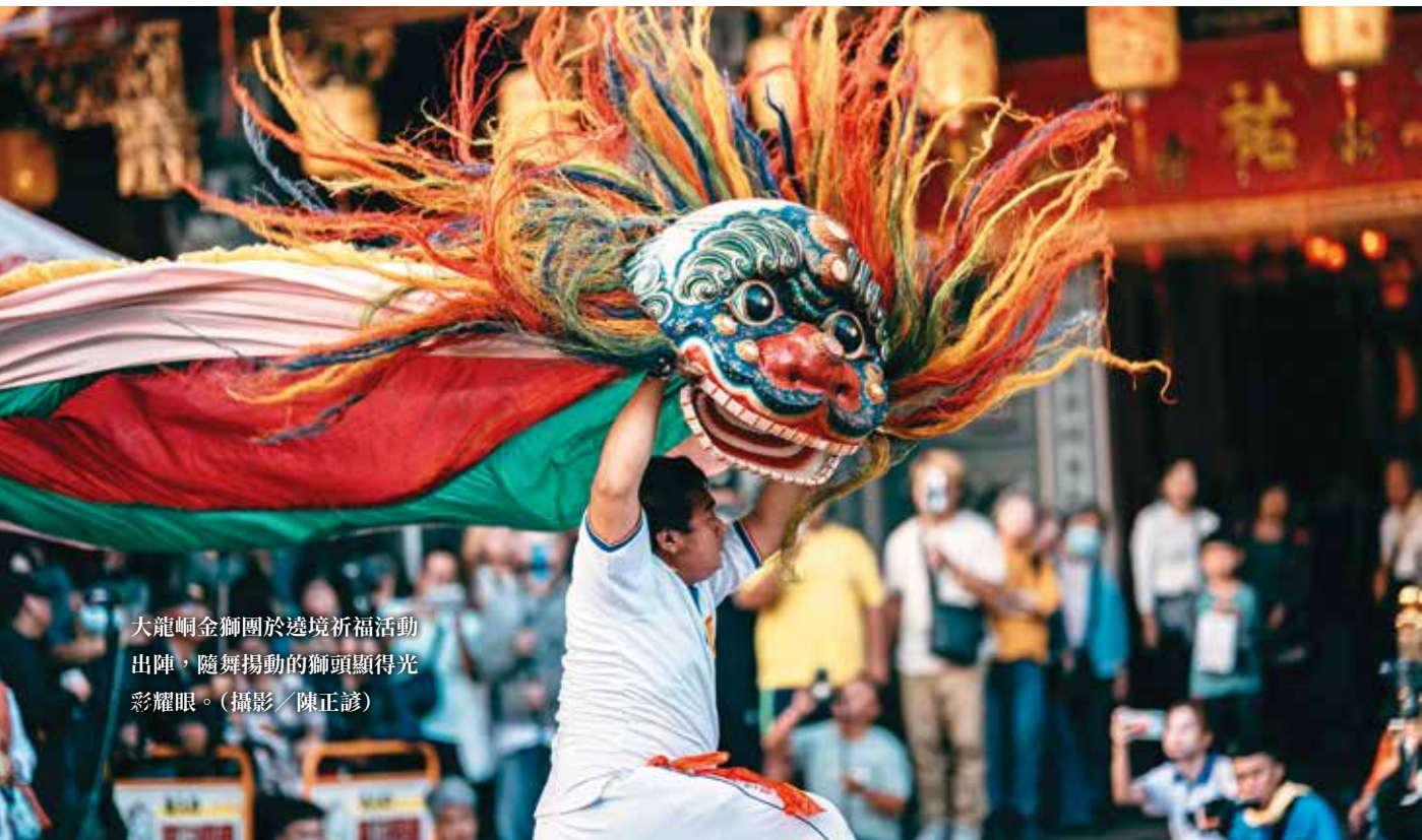
大龍峒金獅團於遶境祈福活動出陣，隨舞揚動的獅頭顯得光彩耀眼。

舞獅者不僅以拳術為基礎模仿獅子的神韻與動作，還會配合劇情推進穿插「家私」（兵器）展演。洪文定舉台灣獅的經典橋段「剖獅」（殺獅）為例，由一人手持大刀與舞獅對峙，展現舞法、武術與家私過招的精彩套路。