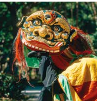
舞獅模仿獅子咬腳的動作與神韻。

隨著時代變遷，獅陣已不再為防衛械鬥而存在，但寓武術於其中的舞獅則流傳下來，成為極富本土特色的傳統表演藝術。廟會神明出巡時，多半由獅陣擔任開路先鋒，一人在前扛起獅頭，一人在後高擎彩被，時而躍高、時而伏低，活靈活現詮釋獅子咬尾、咬腳、睏睡及獅鬃怒張、耀武揚威的模樣。與此同時還有持旗幟、兵器及樂器的隊伍浩浩蕩蕩同行，所到之處無不洋溢歡慶氣氛。