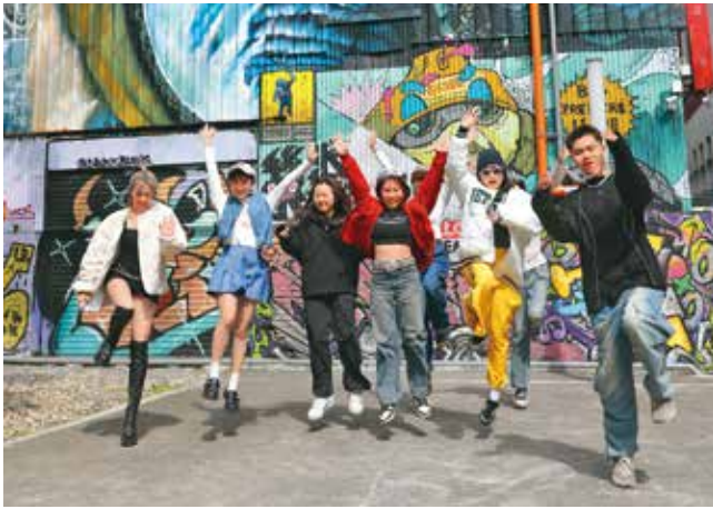
西門町是展現台北年輕活力的舞台