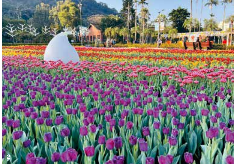
1. 在竹子湖可見海芋花海與小油坑交映的美景。 2. 士林官邸公園的鬱金香花海為園區帶來童話般的氛圍。