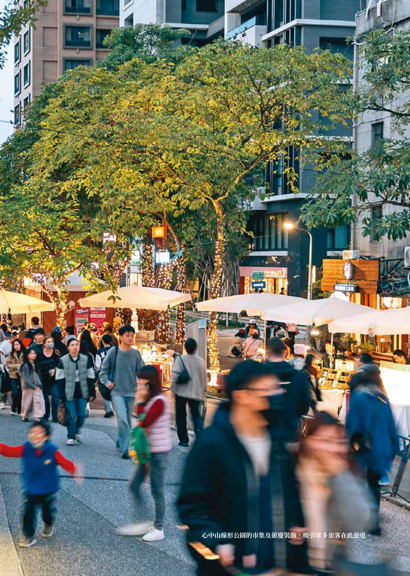
心中山線形公園的市集及節慶裝飾，吸引眾多旅客在此遊逛。