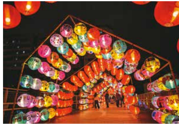
台北燈節將在中華路璀璨登場，以各式燈飾營造節慶氣氛。(資料照)

從台北年貨大街到台北燈節，整個舊城區都在煥發著光彩，不妨規畫一趟專屬於台北西區的新春旅行，探索這座城市既傳統又新鮮的節慶魅力。📍