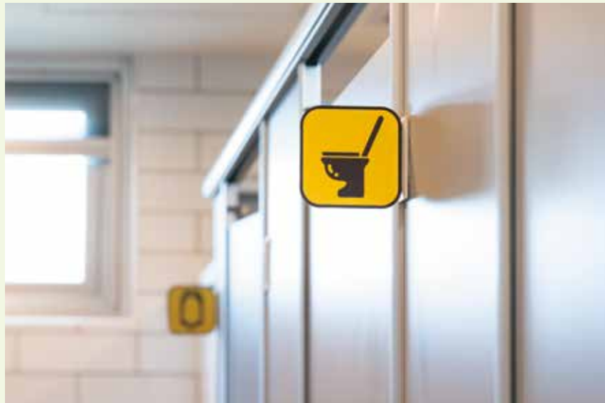
台北市中正戶政事務所率先設置性別友善廁所，廁間門板使用圖案標示，民眾更容易辨識。

隨著性別友善觀念越來越受到重視，中央部會、地方政府與大專院校等紛紛提出性別友善廁所指引，但在硬體細節、名稱與圖示上仍存在差異。台北市性別平等辦公室彙整各方建議，並結合專家意見與多年實務經驗，於2025年公告「台北市性別友善廁所設置參考原則」及「台北市性別友善廁所標章認證計畫」，從廁所名稱、圖示等符號及顏色、高齡與親子友善設施等，都有明確的規範與設計原則可參考。