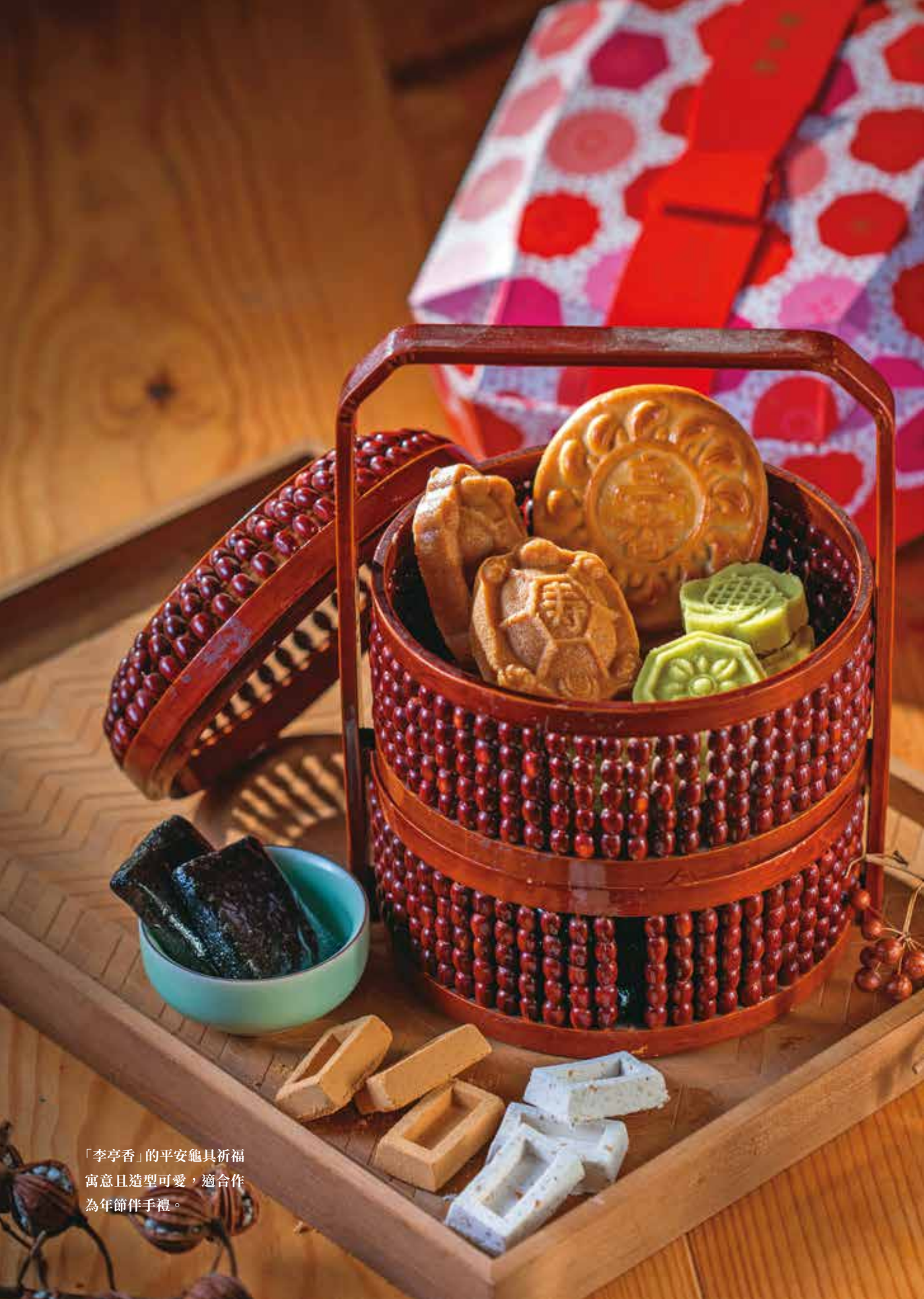
「李亭香」的平安龜具祈福 寓意且造型可愛，適合作 為年節伴手禮。