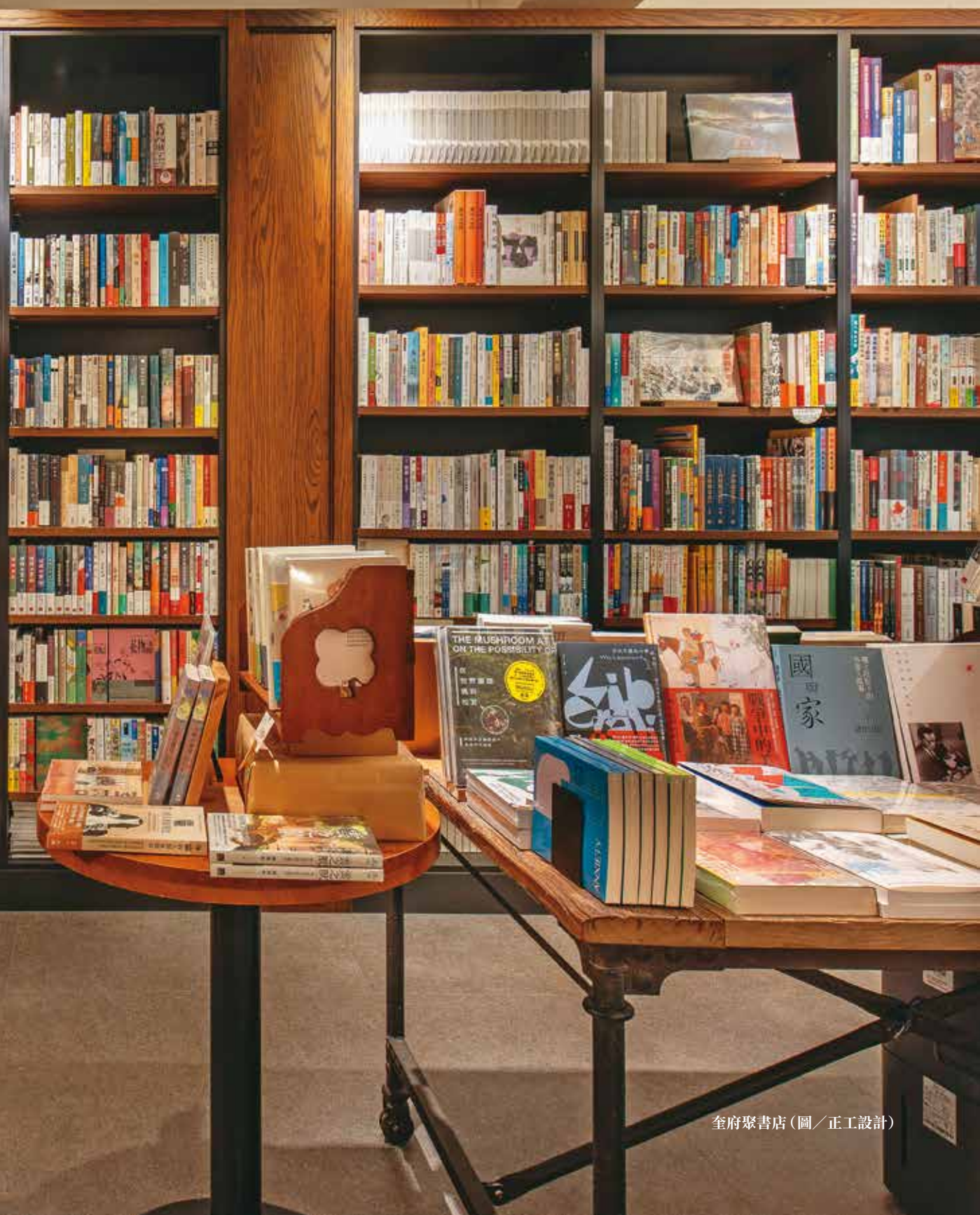
奎府聚書店