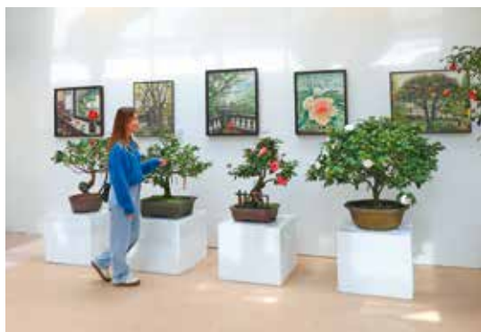
在花卉試驗中心可欣賞各式茶花盆景。

位於仰德大道花卉試驗中心種植豐富多樣的花卉，在「台北茶花展」期間，入口區將以數千株鬱金香及風信子花海迎接訪客，今年更首度規畫「迷霧茶花園」，讓旅客在水霧迷濛中體驗如夢似幻的茶花世界。另也舉辦茶花栽培課程、假日捐發票贈茶花苗及平日絹印紅包袋等活動，邀民眾一同賞茶花、迎新年。