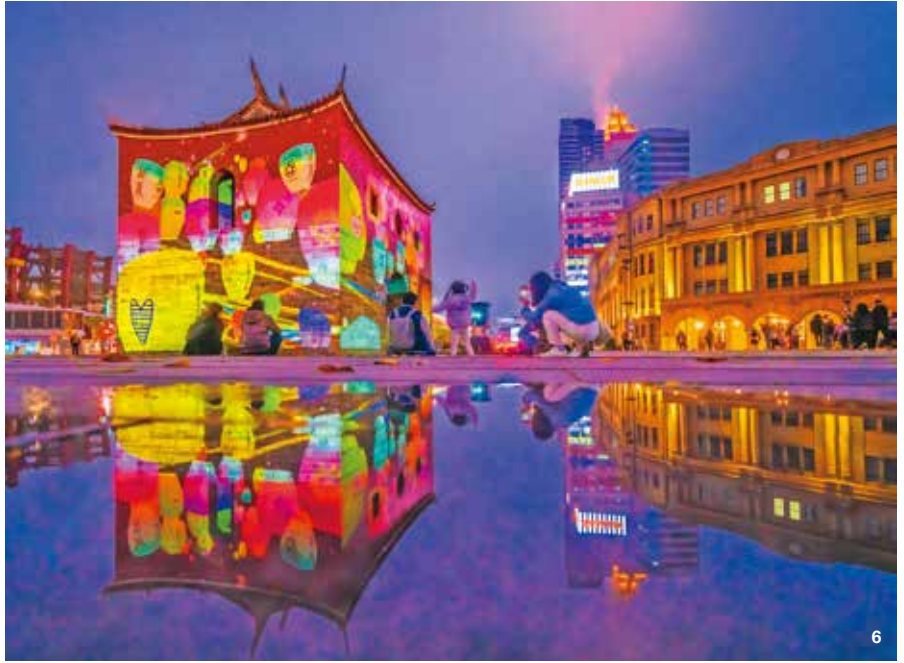
4.2025年主燈「福蛇豆豆」照亮中山堂廣場。(攝影／陳德惠) 5.2024年武昌街燈海隧道，魚燈游過街巷上空，宛若一條發光的年節長河。(攝影／李宜蘭) 6.2024年燈節光雕作品「北門映像」，將老城門映照出新表情。(攝影／張樹山) 7.2021年台北燈節的燈海沿著艋舺街廓鋪展，勾勒出傳統與現代交會的軸線。(攝影／鄧珍詩)(圖4-7: 台北市北門相機商圈發展協會)