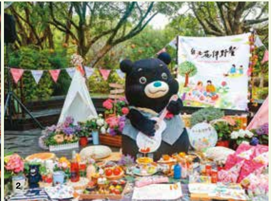
1.內湖樂活公園櫻花綻放，夜晚更顯浪漫風情。(資料照／台北市工務局公園路燈工程管理處) 2.「2026 台北花伴野餐」邀請民眾前來大安森林公園共度愜意時刻。

「2026 樂活夜櫻季」將於1月30日揭幕，並邀集在地學校與社區團體帶來暖場演出，2月7日則規畫野餐寫生、星光電影院與表演節目等活動，歡迎民眾前來與櫻花美景共度美好假日。