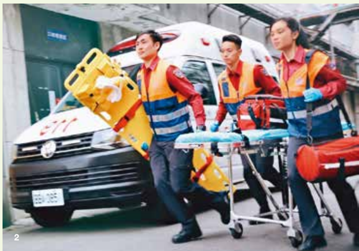
1.消防局鼓勵民眾學習心肺復甦術(CPR)，在必要時能救人一命。 2.救護人員迅速出勤，把握黃金救援每一秒。