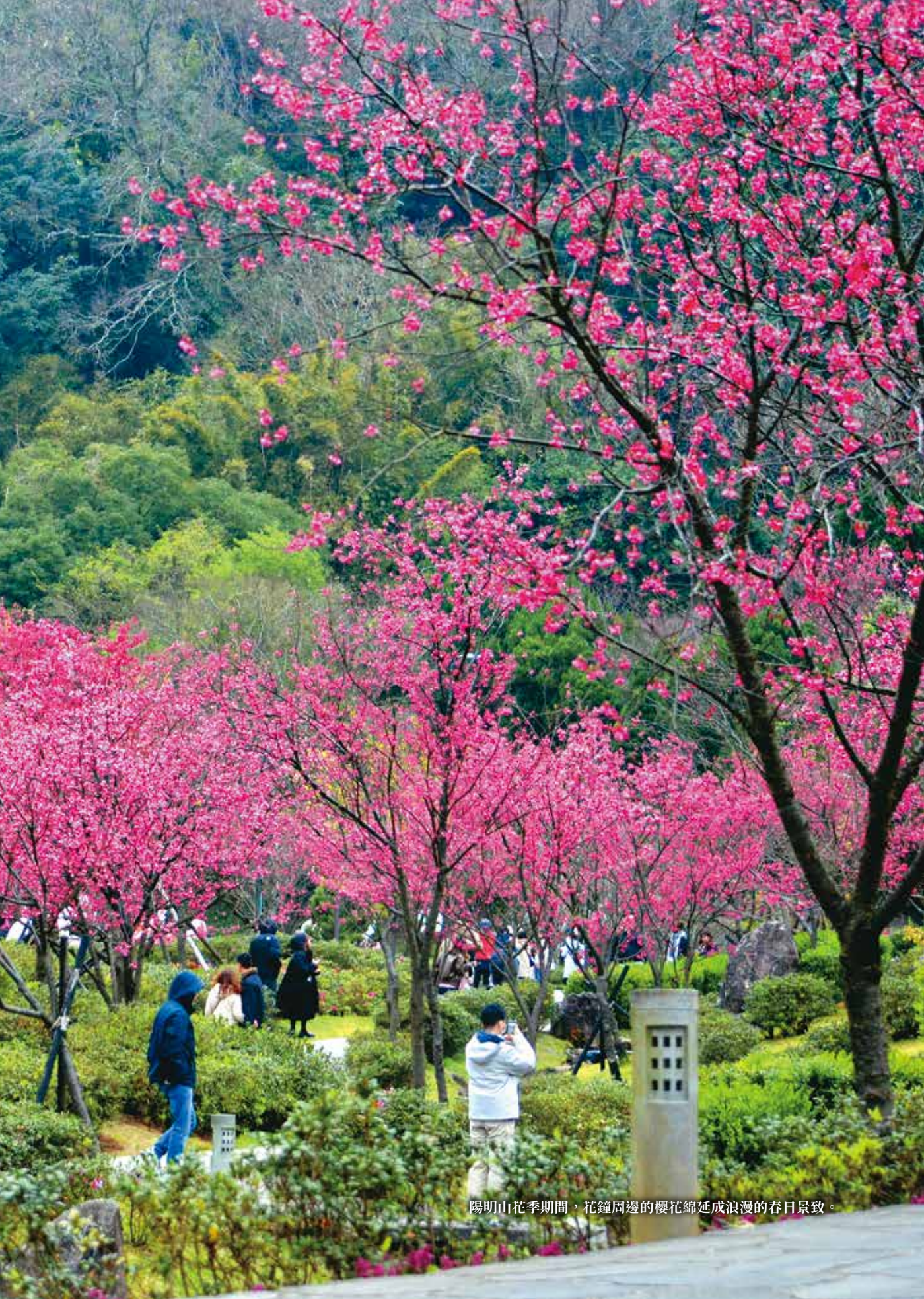
陽明山花季期間，花鐘周邊的櫻花綿延成浪漫的春日景致。