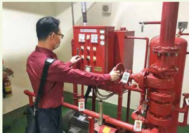
消防局針對不同場域進行系統性檢查，確認各項設施能正常使用。