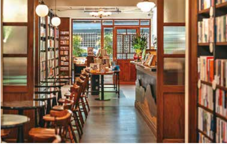
奎府聚書店運用仿舊木門等元素，讓空間與舊記憶產生連結。(圖／正工設計)