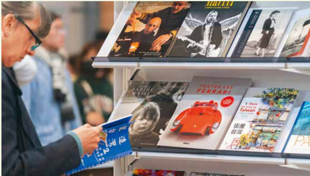
台北國際書展規畫多個主題展區，邀請民眾感受豐富多元的閱讀魅力。(資料照)

童書主題館則從日常的「菜市場」汲取靈感，設立「心靈有機屋」、「情緒廚房」和「知識能量站」等不同主題攤位，以童書取代料