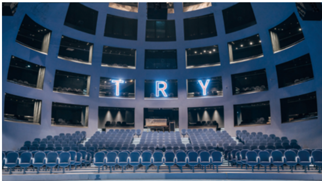
臺北表演藝術中心的球劇場，設置半弧形觀眾席及半開放包廂，讓所有觀眾都能享有最佳欣賞體驗。