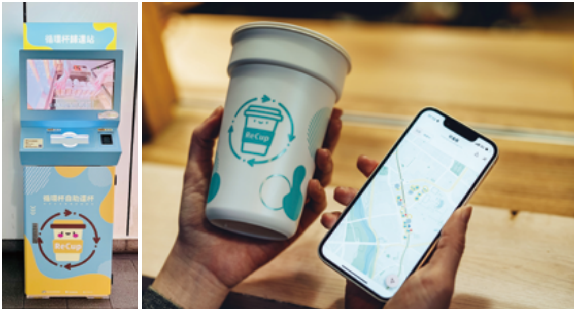
左：設在捷運公館站 1 號出口的循環杯自動歸還站機台。右：打開「好盒器」LINE，就能輕鬆查找參與台北循環杯計畫的店家。

人口密集，只要在一定的地理範圍內設立足夠的循環杯借還站，讓消費者借還便利，就能提升使用意願。