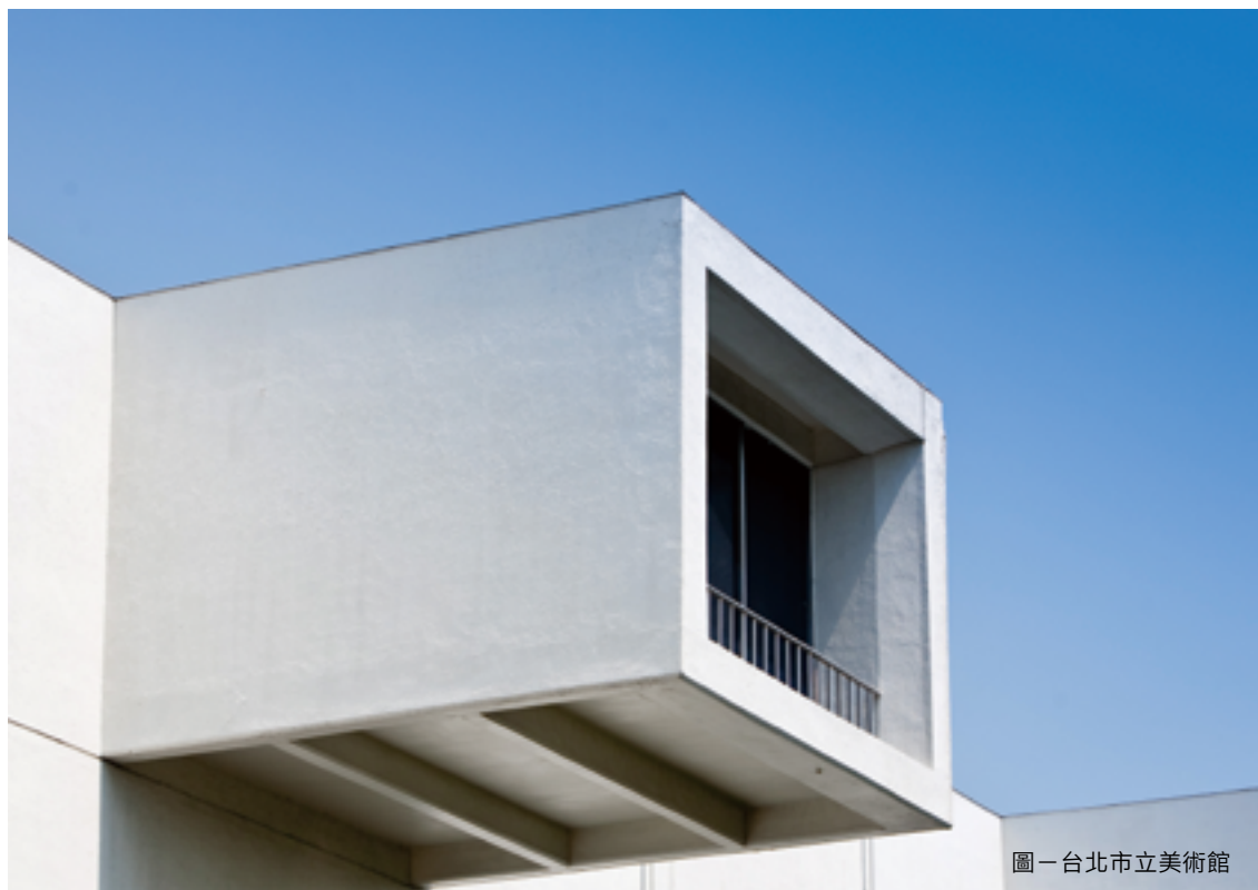
圖一台北市立美術館

因著不同的使用目的與設計思考，建築早已不僅是單純的功能性設施，公共開放、藝術美感、綠色永續……建築被賦予了不同的價值，成就了百花齊放的城市風景。