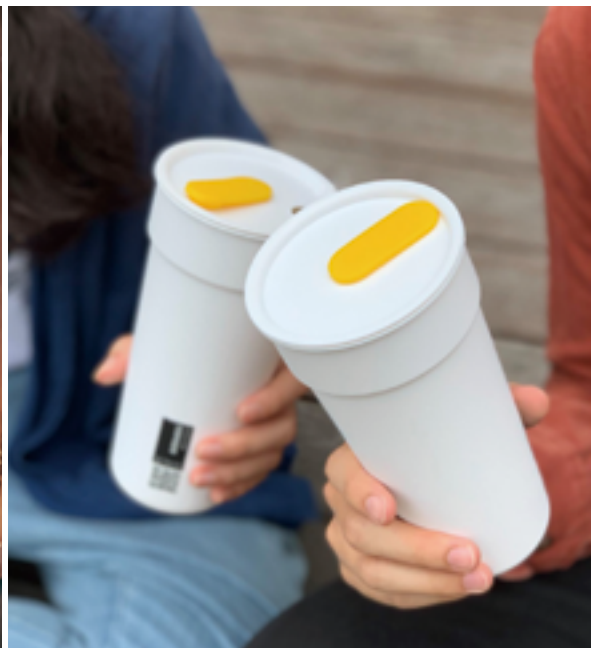
以外帶消費為主的咖啡店，利用循環杯盛裝飲料，減塑又便利。