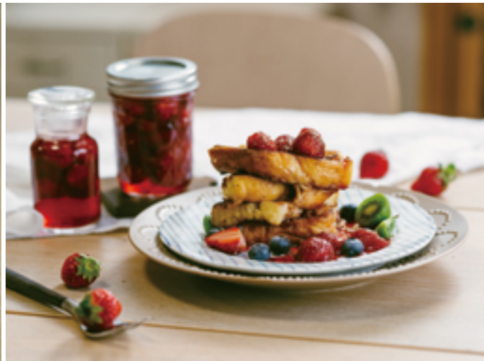
左：使用草莓與桑椹，熬煮出雙重莓果的酸甜層次。右：將自製草莓醬淋在法式吐司上，擺盤繽紛、味覺也富有層次。

做果醬的水果萬萬不求甜，過甜則單薄一味無個性，且糖酸比才是重點，有甜韻且有酸味，果肉扎實更好。水果大都能熬成果醬，決勝點在於蘊藏的天然果膠多寡，果膠受熱釋出凝膠成醬，蘋果是模範生，唯一要說不適合的就是瓜果了。瓜果是大自然設計讓我們解渴用的，所有的香氣都在果汁，與熬煮果醬要大量蒸發水分的濃縮原理大相逕庭。像是西瓜、哈密瓜、美濃瓜熬煮後香味盡失，只留下纖維與糖的甜味，最終只能做為鳳梨酥之類點心的填充瓜果醬。