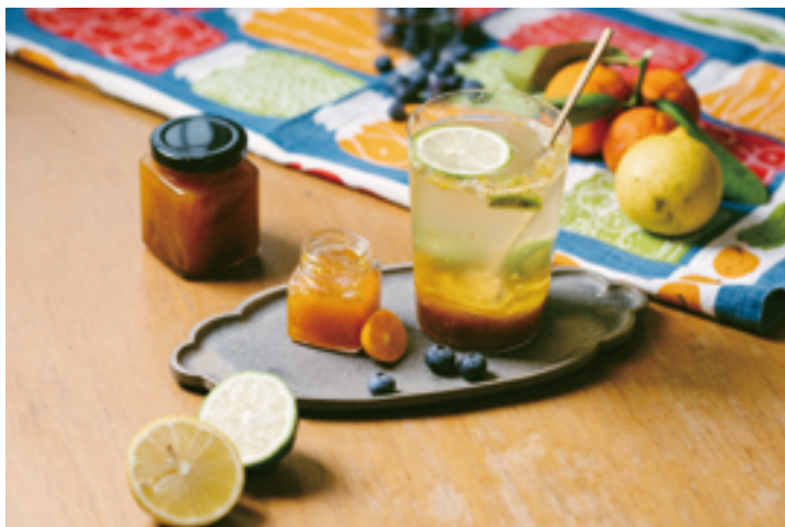
左：台式香腸淋上適量的春日野莓果醬，滋味令人難忘。右：果醬雞尾酒可以品出水果香甜，更能引出酒香。