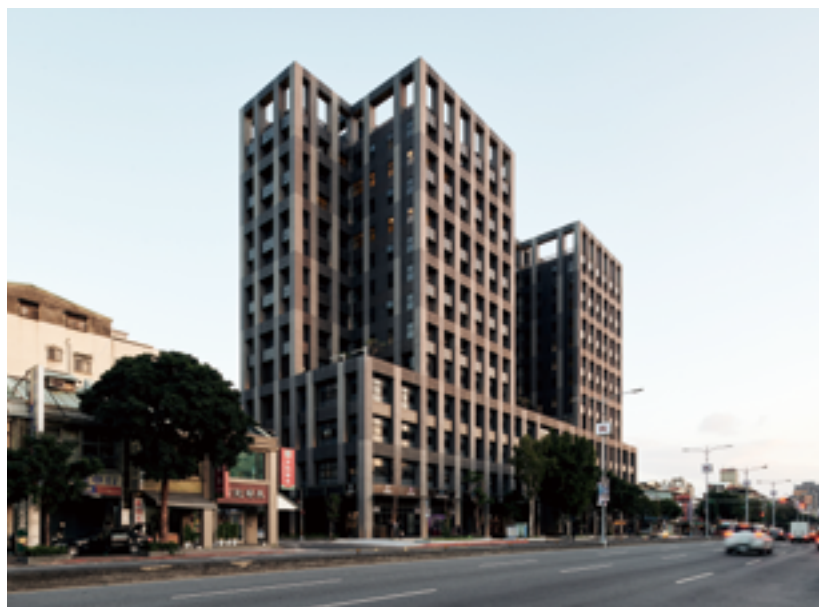
大龍市場原為海砂屋建築，透過建築師巧妙設計，翻修為多功能的公共生活空間。(圖／Q-LAB 建築師事務所)