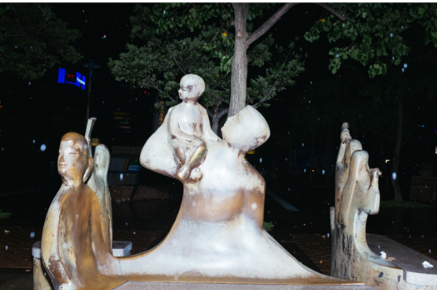
台北車站南側廣場造型雕塑座椅