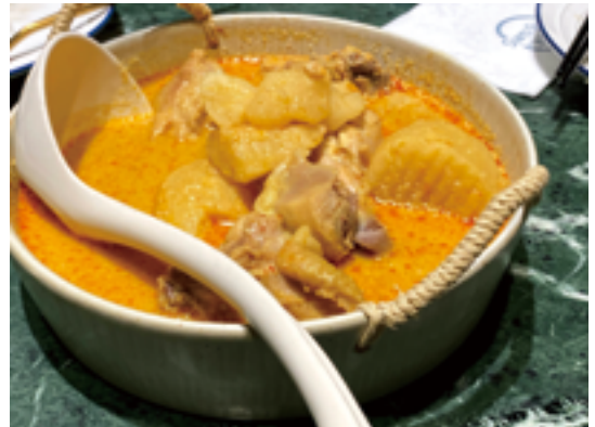
這是正宗泰式咖哩雞嗎？

娘娘越說越激動得可愛，那麼椒麻雞又是怎麼變成泰式料理的？維基百科又來說清楚講明白了，大抵一是源自雲南菜的再創作，