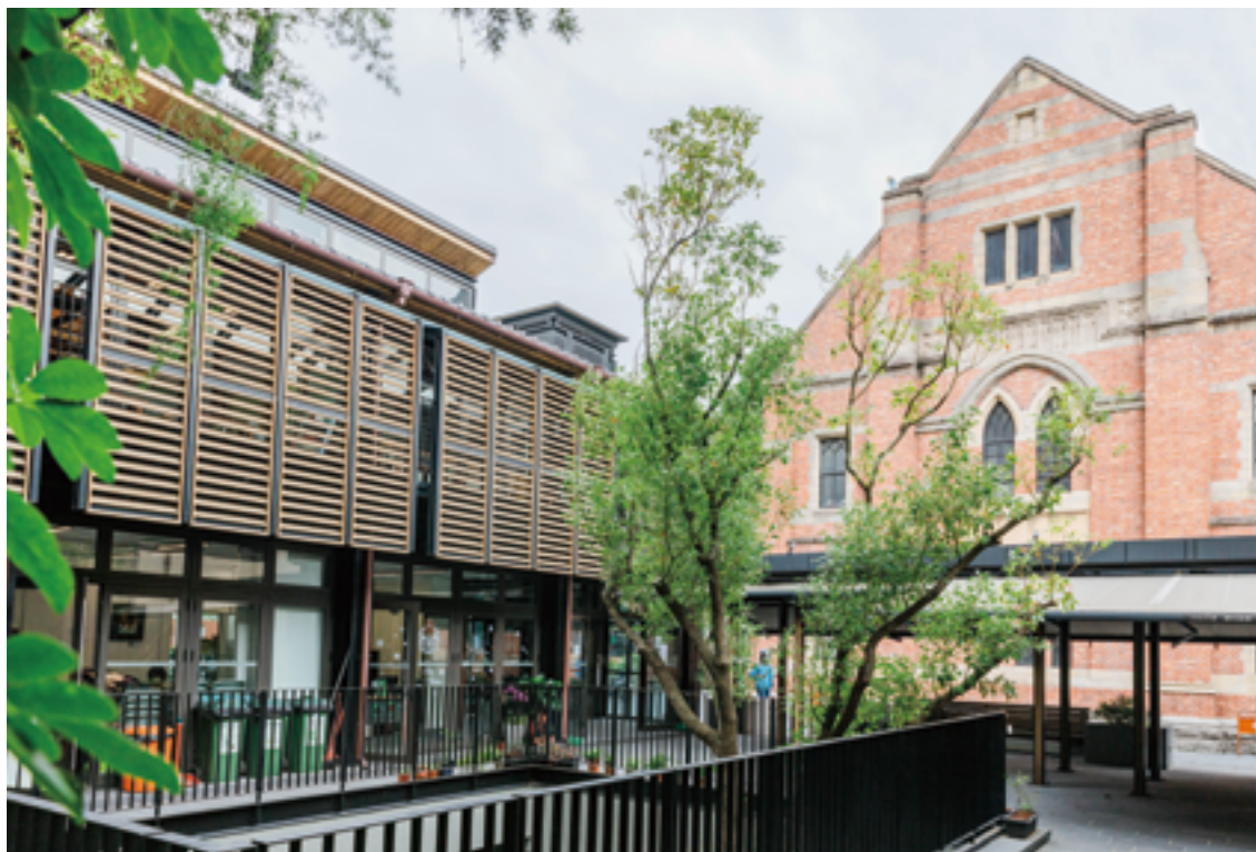
濟南教會的教堂本體和新建成的宣教中心，景觀呈現新舊交融的魅力。