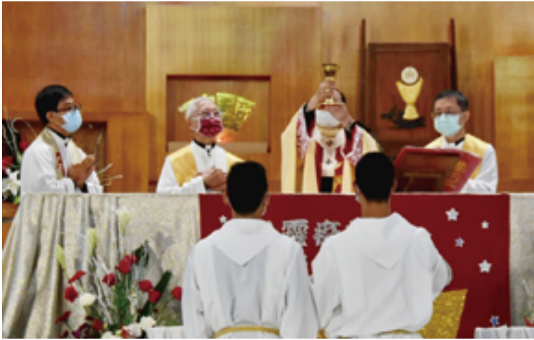
神職人員每個主日要舉行彌撒，透過莊嚴的感恩儀典提供教友心靈安定。