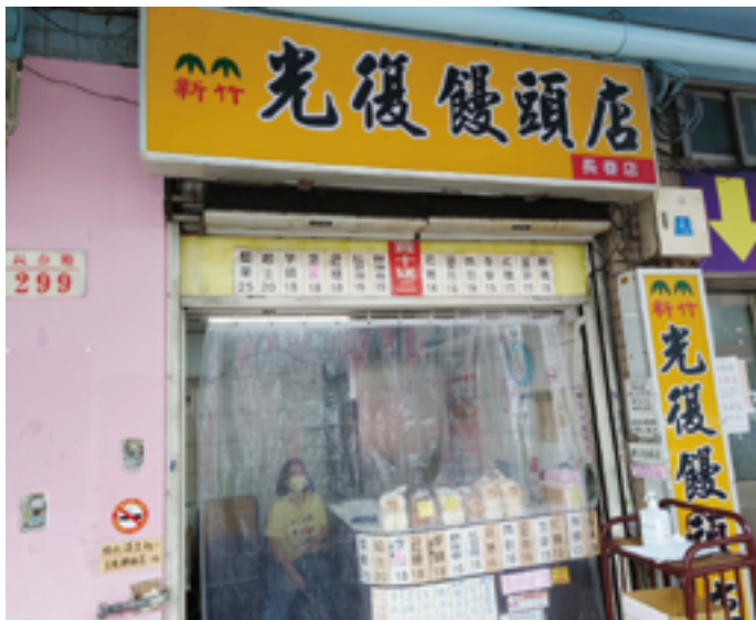
左：西湖市場在導入食品良好衛生規範準則（GHP）後，攤位環境更加乾淨整齊。右：長春市場攤商經過食安團隊協助輔導，設置防蟲的透明簾，有效減少蚊蟲問題，提升食品安全。

食材的器具、存放食材的容器等，稍不留意，就可能讓看不見的問題竄到食材中。因此 GHP 規定，攤商切割生熟食的刀具、砧板應分開使用，並經常性地清洗，以免造成交叉感染。食材不可直接接觸地面，裝置菜餚食品之器具也需具備防塵、防蟲、防口沫等功能。