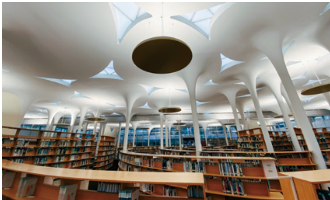
台大社科院圖書館內部立柱造型神似蓮花莖，充滿特色且富有奇趣。